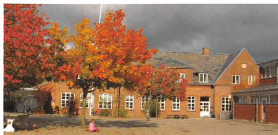
Hejls Skole. Foto Gunnar Krag, 2008.

Da finansieringen af et nyt plejecenter først skulle på plads, blev den endelige beslutning om skoleprojektet ikke klar før i 2006, og derfor var det nu Sammenlægningsudvalget i den nye kommune, der skulle give grønt lys. Her blev det imidlertid besluttet at udsætte en endelig godkendelse, til en samlet analyse af den nye kommunes samlede skolevæsen ville være på plads i løbet af 2007. Det har betydet, at den nye samlede skole, der har fået navnet Christiansfeld Skole fortsat fungerer på de to samme adresser som tidligere, men med én ledelse og et samlet personalekorps. Bygningerne bliver anvendt på den mest hensigtsmæssige måde, så hele indskolingen foregår i bygningerne i Lindegade og undervisningen af de ældste elever i skolen på Gl. Kongevej.