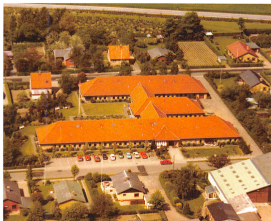
Plejehjemmet Birkebo. Foto fra 1980.

I starten af 1990'erne vedtog Byrådet en ældreplan, der bl.a. indebar, at plejehjemmene i lokalbyerne blev omdannet til ældreboliger uden plejefaciliteter. Inden da var