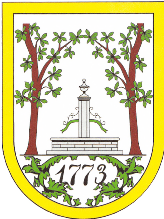
Christiansfeld Kommunes byvåben.