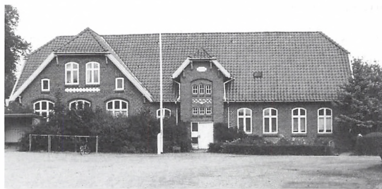
Øverst Tyrstrup Skole, derefter Christiansfeld Realskole, nu Christiansfeld Skole, Hjerndrup Skole og nederst Aller Skole.