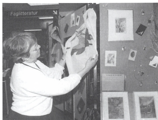
Biblioteket i Christiansfeld. Foto fra 1992.

Ved starten i 1973 var der tilmeldt 70 elever til musikskolen. Ud over elevbetalingen blev der det første år givet 25.000 kr. fra kommunen og 10.000 kr. fra Sønderjyllands