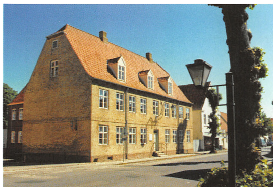
Nørregade 12, rådhus i Christiansfeld Flække og Christiansfeld Kommune frem til 1983.

Med de mange ny kommunale funktioner i storkommunen blev der hurtigt pladsman-