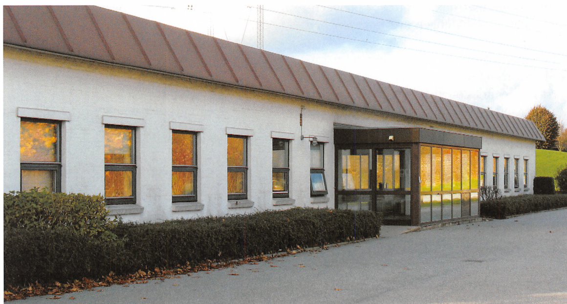
Christiansfeld Rådhus, H.C. Ørstedsvej 1, 1983-2006.