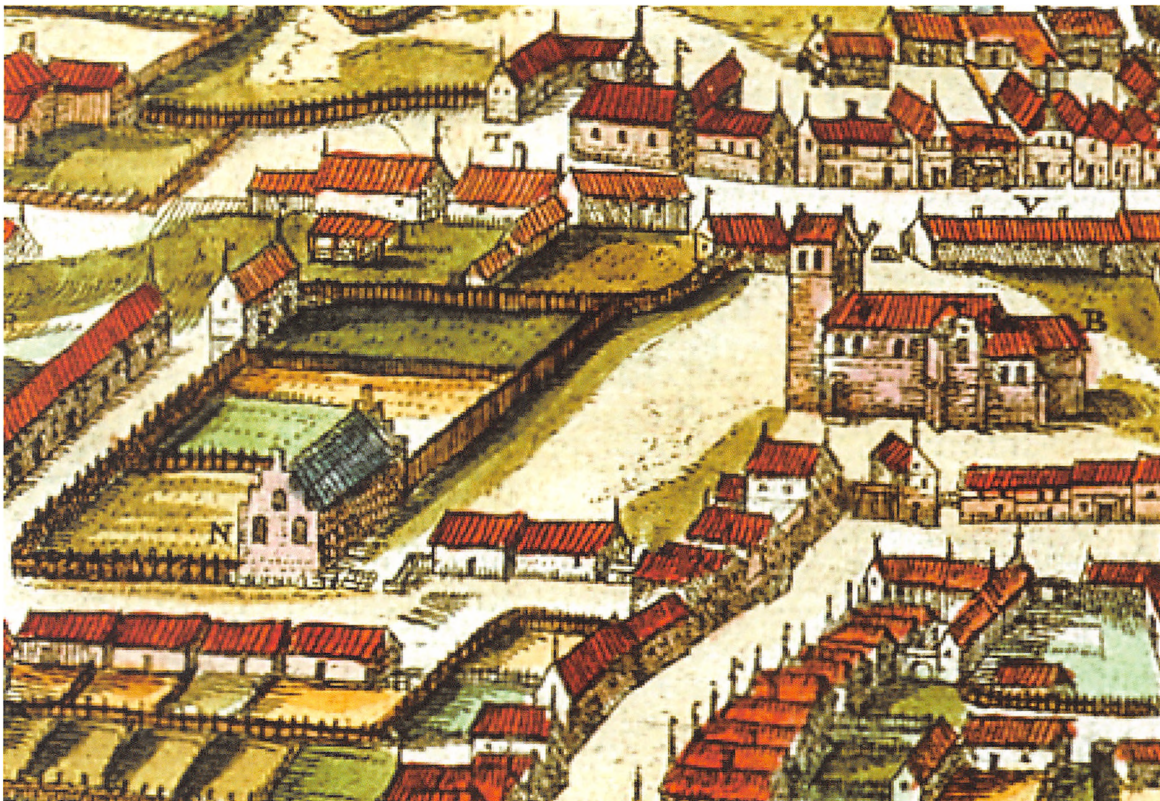
Udsnit af Brauns og Hogenbergs prospekt af Kolding fra 1587. B er Kolding Kirke, N er Kolding Latinskole.

les læserum for alle elever. Det var et langt forholdsvis smalt lokale med lerklinede vægge, gulvet af mursten eller stampet ler, synlige loftsbjælker og ikke ret mange, højtstående vinduer. Ruderne har været små og blyndfattede, halvt uigennemsigtige med en pukkel i det grønne glas som bunden af en flaske. Fra 1590 da skolen begyndte at dimittere til universitetet, er rummet blevet opdelt med en halvmur og derover et tremeværk. I det adskilte værelse er ældste klasse blevet undervist af rektor, de tre andre klasser af hørerne.