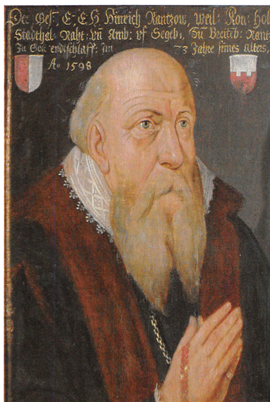
Maleri forestillende statholder i Slesvig, Henrik Rantzau.