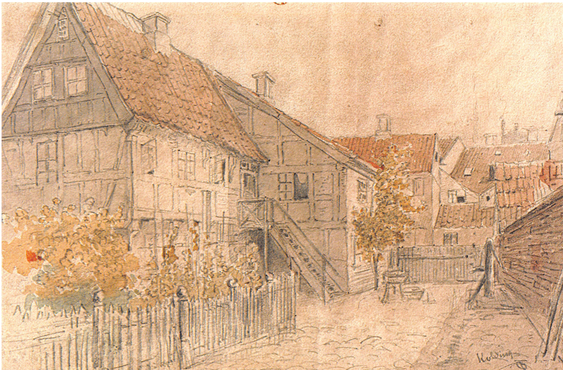
Den gamle rektorbolig malet af P. Toft.

Efter skoleanordningen af 1546 skulle undervisningen om sommeren begynde kl. 5.30 om morgenen, i de mørkeste vintermåneder dog "først" kl. 6.30. Det skal erindres at læsetimerne kun var en del af pligtarbejdet, idet den daglige korgang morgen og aften, sangopvarmningen og den tvungne kirkegang både om søndagen og visse hverdage lagde stærkt beslag på deres tid.