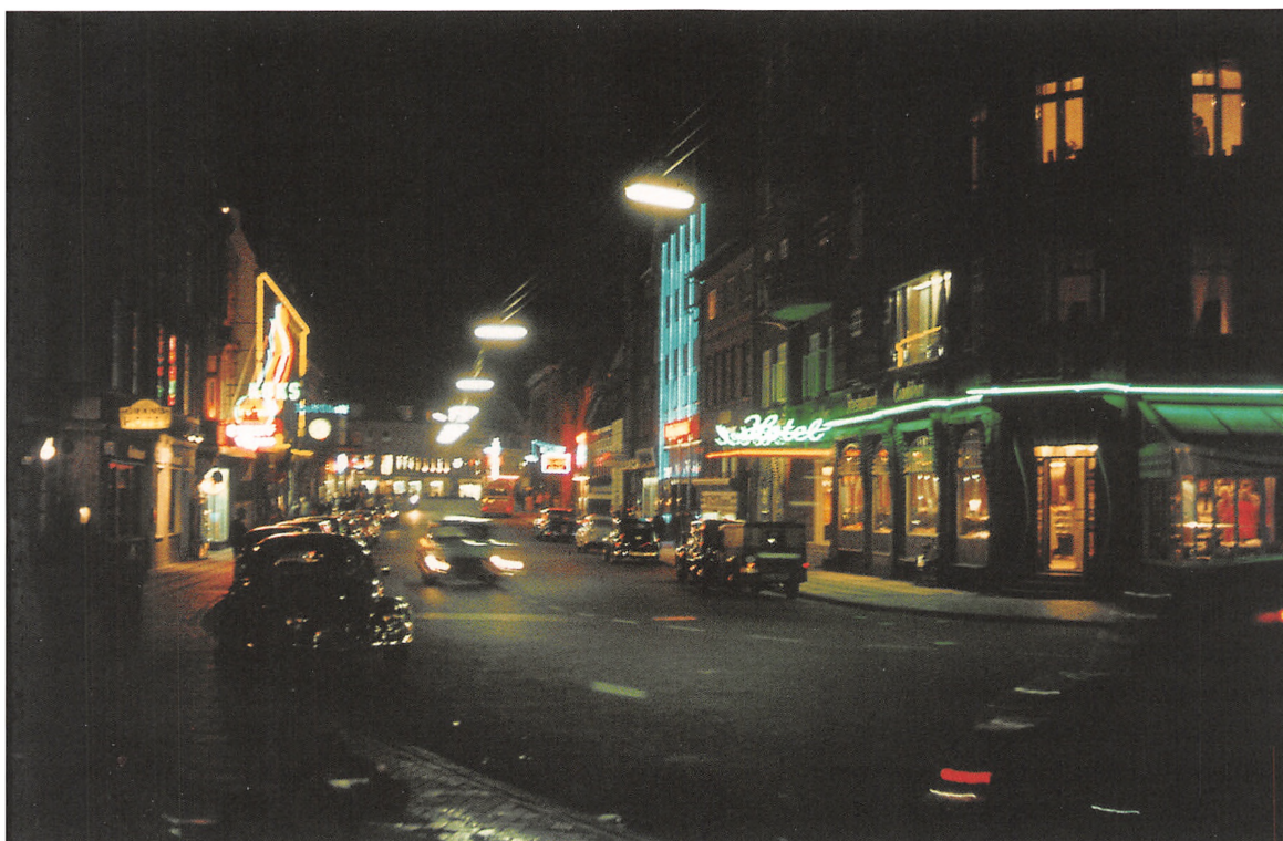
Jernbanegade "by night" i 1958.

Hvis vi fik lov, hændte det, at jeg og et par af pigerne hjemme fra gaden fulgtes ad til bal på Alhambra, der lå for enden af Sct. Michaelsgade lige før Stejlbjerganlægget. Eller vi tog ud til Marielundpavillonen, som lå der, hvor Naturskolen nu er opført. Så blev der spillet den musik, vi godt kunne lide, og vi kunne sidde en hel aften over en