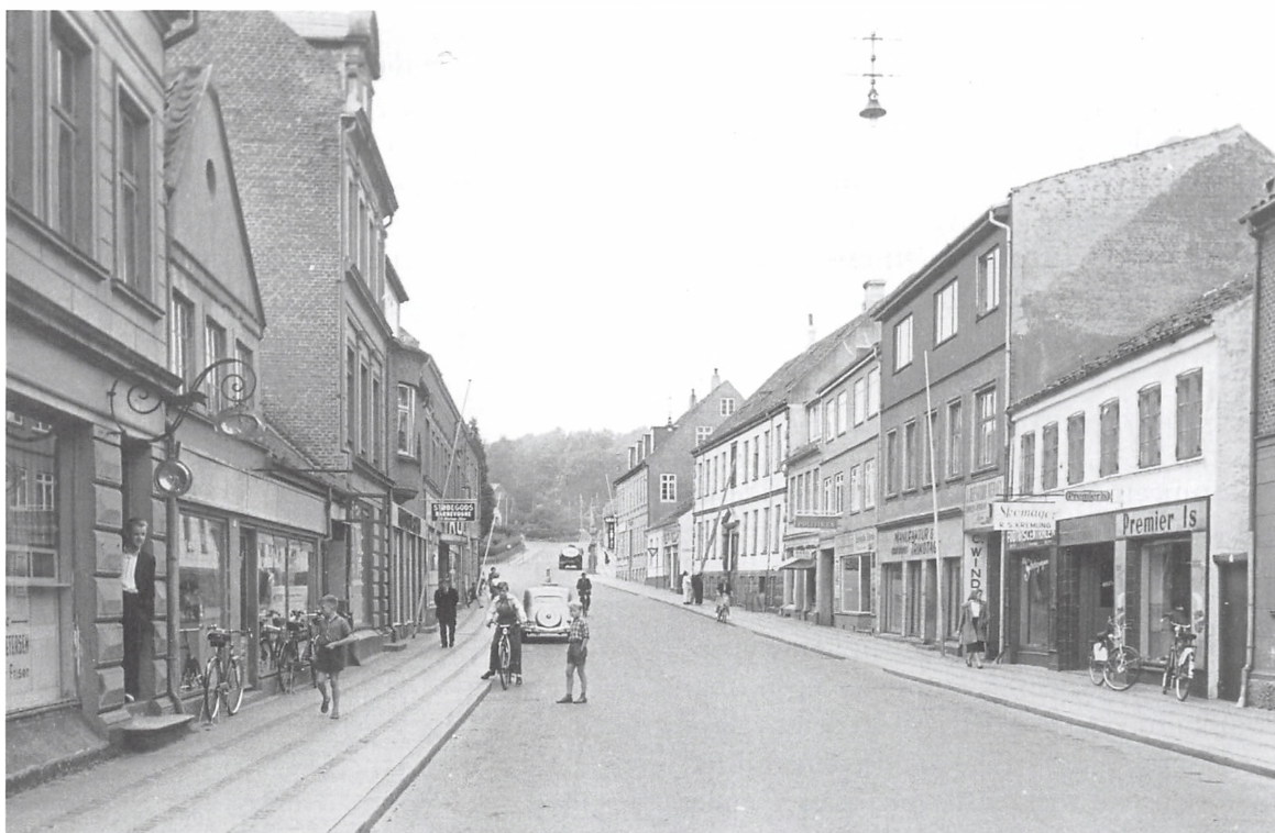
Den nordlige del af Låsbygade, ca. 1950.

Vi havde heller intet køleskab eller dybfryser dengang. Vores værtinde havde et isskab, og til det købte hun et par gange om ugen en stor blok is hos mælkeemanden til at holde