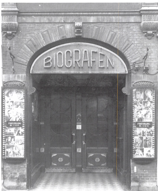
Biografen, Helligkorsgade 14, ca. 1950.

der var helt, og hvem der var skurk. Poul Reichhardt var i de år det helt store helte- navn, ligesom Bodil Kjør var den store diva, og deres samspil i "Soldaten og Jenny" var virkelig godt. Men jeg har nu aldrig været så vild med Poul Reichhardt, han var for pæn, og efter at have set ham optræde i et tivoli, syntes jeg også han var for krukke. Nej, så hellere Ib Schønberg, som jeg så optræde på Kolding Vandrehjem engang. Han havde naturlighed og udstråling. Men den mest betagende film, jeg så i de år, var den svenske "Driver dug falder regn". Filmen, der rummede en smuk kærlighedshistorie, foregik i skønne naturomgivelser, og oven i det fik man den dejligste svenske spillemandsmusik