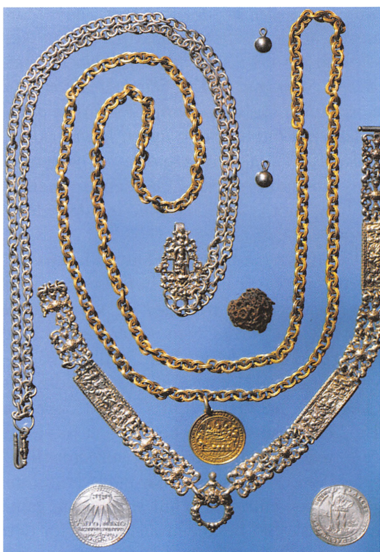
Eltangårdfundet. Den yngste mønt er fra 1653. Fotograferet efter Fritze Lindahl: Skattefund, 1988.