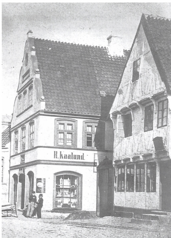
Helligkorsgade 18-20 fotograferet ca. 1870. Det er nr. 18 til højre.

kussens gård ansat til beskedne 80 sletdaler (sld). Han beskrives som "en af Byens Raadmænd, som sejler som Styrmand for Nyborg".