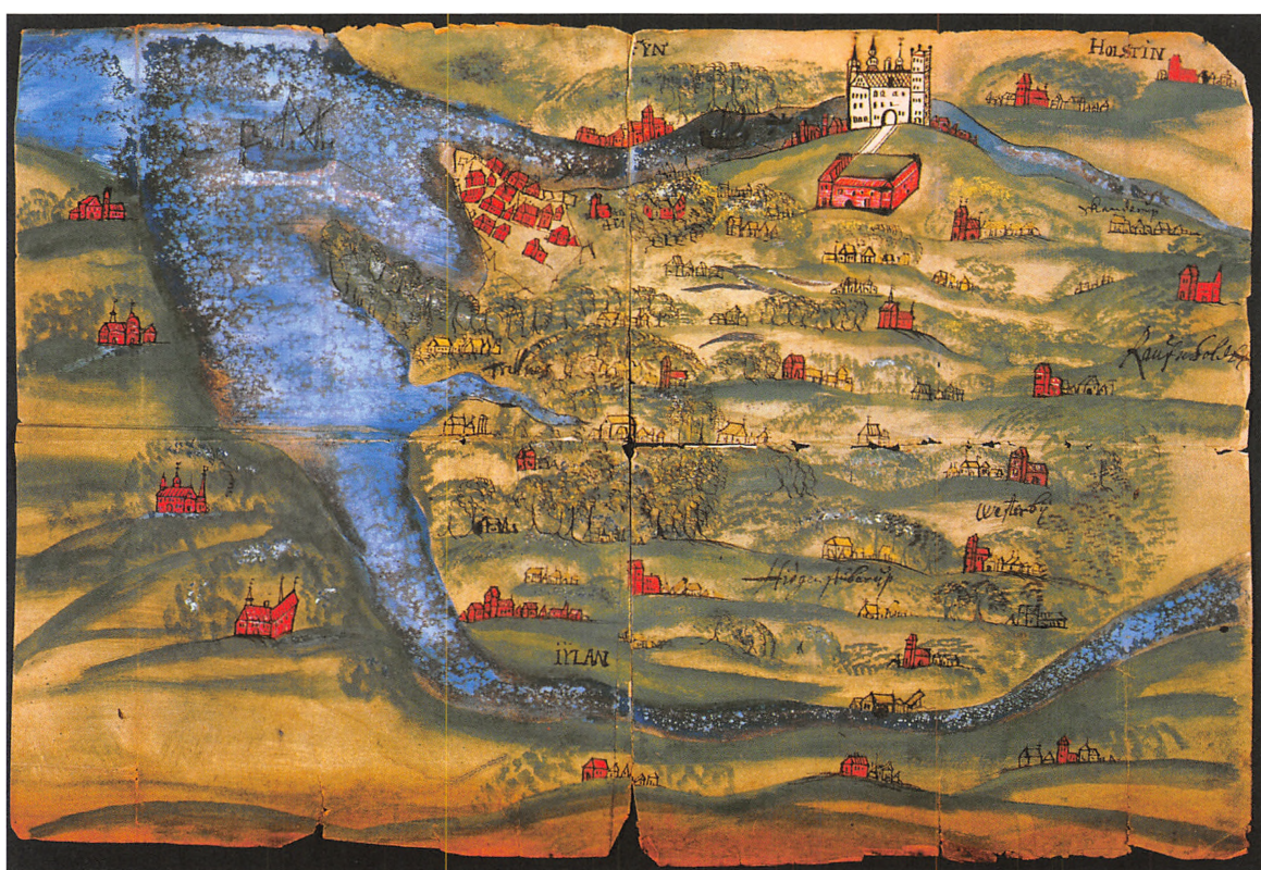
Prospekt over Koldingegnen ca. 1700. Original i Rigsarkivet.