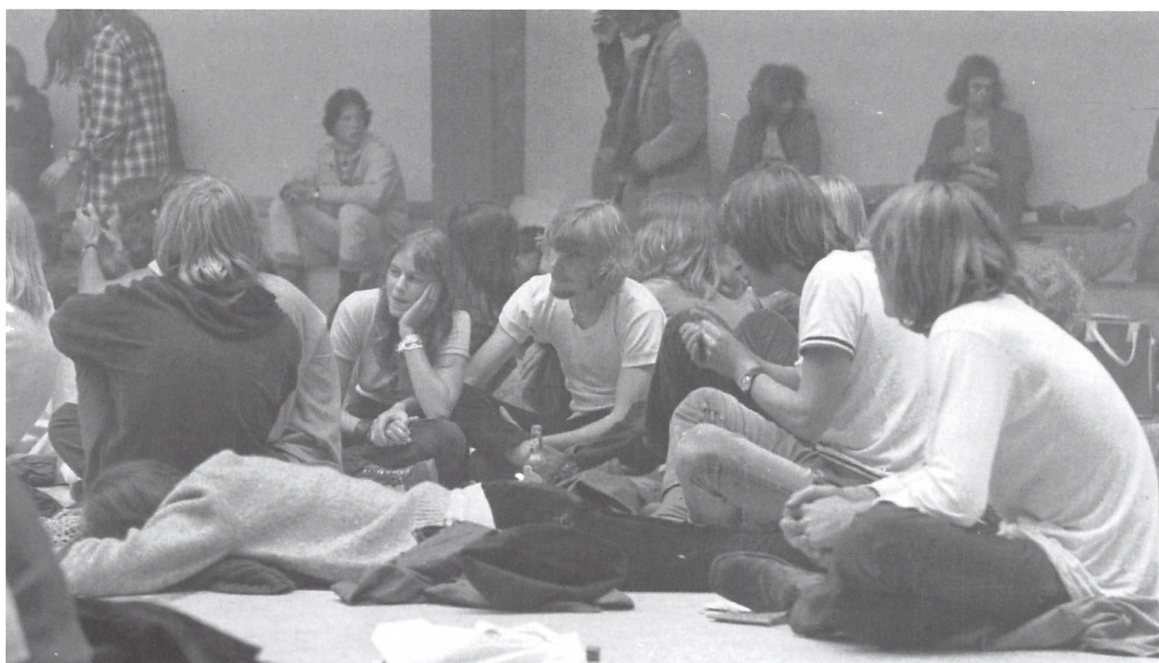
Tilhørere ved den store Beatfest i KIF-hallen i 1972.

No Name med Stig Møller varmede op til aftenens højdepunkt, og så til sidst kom de så. Danmarks største navn – selveste Skou-