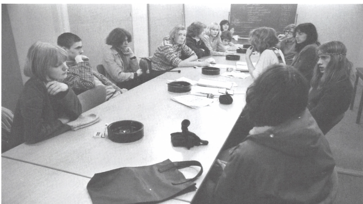
Drøftelse af husprojektet ved et møde på biblioteket 3. februar 1972.

sen og Ingemann gik på scenen i KIF Hallen. Herfra hvor vi står – kan vi se os omkring – til alle sider. Jo ikke et øje var tørt. Det var fantastisk. Det hele sluttede omkring midnat. Vi havde som arrangører lovet at rydde op, men midt i rodet kom virkeligheden tilbage til foreningen Alle. Der manglede omkring 2.000 kr. i kassen for, at Skousen og Ingemann kunne få deres hyre. Det var mange penge, men vi blev reddet på strengen af en venlig ismand, som netop havde så mange penge i kassen. Dem lånte vi og håbede, vi kunne skaffe dem igen et eller andet sted fra.