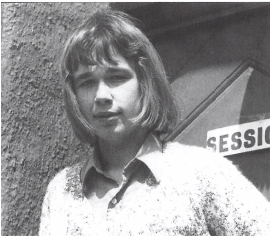
Artiklens forfatter som 18-årig i 1971.

En af grupperne havde startet et såkaldt "Nissearbejde" efter hollandsk model, hvor man ville besøge gamle mennesker i Kolding. Ideen var, at man skulle få en besøgsven på fortrinsvis Låsbyhøj og forene unge og gamle i byen. Dette arbejde fortsatte et stykke tid efter mødet på Biblioteket og var en forløber for vore dages besøgsvenner.