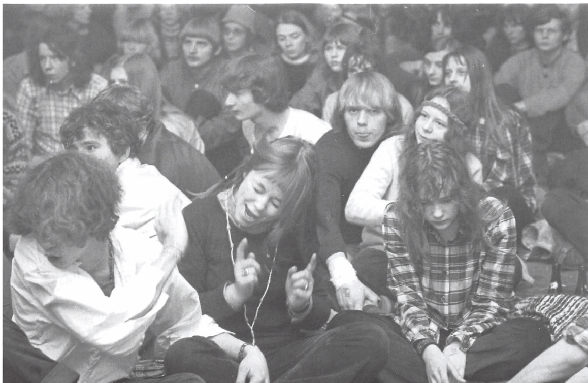
Foto fra ALLEs et års fødselsdag, der blev fejret ved et lokalt musikarrangement på Kolding Gymnasium. Danmarks Radios Ungdomsredation sendte trekvarters direkte udsendelse på P3 fra arrangementet. Kolding Folkeblad 6. marts 1972.

På musik siden blev der holdt op til flere beatkoncerter på skolerne rundt i Kolding med bl.a. Cy Maia og Robert, Culpeppers Orchard, Moirana og mange lokale bands som Akropolis og Red Mustangs. Skolerne var dog ikke videre samarbejdsvillige omkring arrangementerne, da der til tider var så