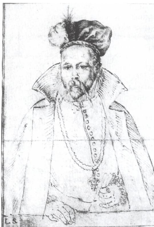
J. de Gheyns blyantstegning af Tycho Brahe, ca. 1586. Original i Kobberstiksamlingen.

Tycho Brahe var ansat ved den tysk-romerske kejser Rudolf 2.s hof. Rudolf regerede et meget stort område i Europas hjerte, men isolerede sig – presset, barnløs, virkelighedsfjern, tiltagende sindssyg og politisk inkompetent – på sin kæmpeborg med udsigt over Prag. Den sky kejser interesserede sig for alkymi og kunst og havde tidens bedste kunst-