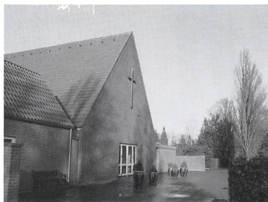
Kapellet på Sdr. Kirkegård, som det ser ud i dag.

I slutningen af 1980'erne havde den kraftig lydende kirkeklokke givet anledning til så mange klager, at blev besluttet at flytte klokkestablen ud på kirkegården og anskaffe en ny kirkeklokke. Det skete i 1989. Den gamle klokke kom til Den gamle Kirkegård, hvor træerne dæmpede lyden.