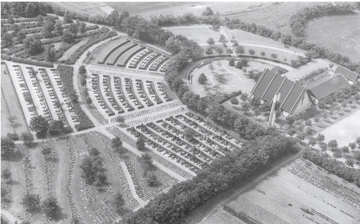
Luftfoto af Ndr. Kirkegård fotograferet af Ludvig Dittmann i 1988.

munale ligning. Det var på det tidspunkt som det eneste sted i landet, hvor menighedsdrevne kirkegårdes drift blev taget over kommuneskatten. Ved forhandlinger med Kolding Byråd i 1976 enedes man om, at kirkegårdene fortsat skulle drives under menighedsrådenes ansvar, men at udgifterne skulle tages over kirkeskatten. Kirkegårdenes regnskaber og budgetter er fra 1925 fremlagt og godkendt på fælles menighedsrådsmøder.