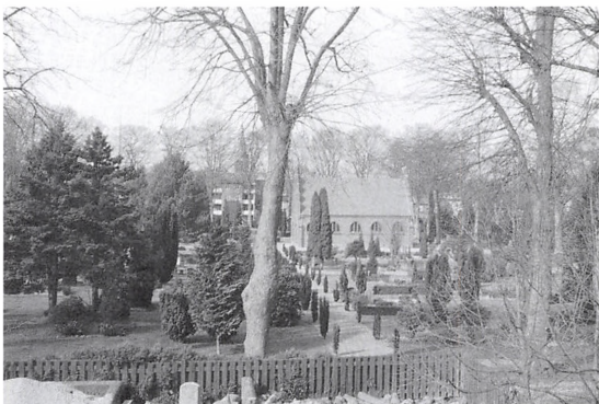
Kapellet på Kolding gamle kirkegård.

og I nu også er inddraget i kirkegården. Dette bekræftes af et bykort fra 1891. Af arealet blev senere, bl.a. i forbindelse med anlæg af Bredgade afgivet en mindre del af kirkegårdens nordøstlige hjørne, og i 1988 blev afgivet en større trekant ud mod Tøndervej og Haderslevvej i forbindelse med Tøndervejs udvidelse. Til gengæld blev i 1985 købt grunden Clemensgade 19 B til kontor/mandskabslokale/mødelokale og materialebygning.