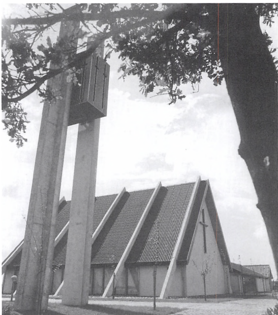
Kapellet på Ndr. Kirkegård, ca. 1980.

Fra 1966 arbejdedes med bygning af kapel, kontor, mandskabsrum og et klokketårn. Pla-