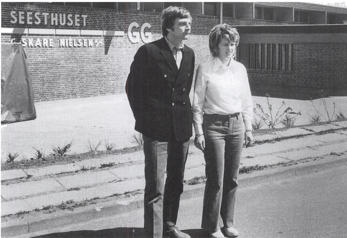
Den 1. maj 1973 flyttede firmaet ind i nyopførte administrations- og produktionslokaler på Overbyvej i Seest.

gange om ugen forlod Seest med kurs mod Tyskland.