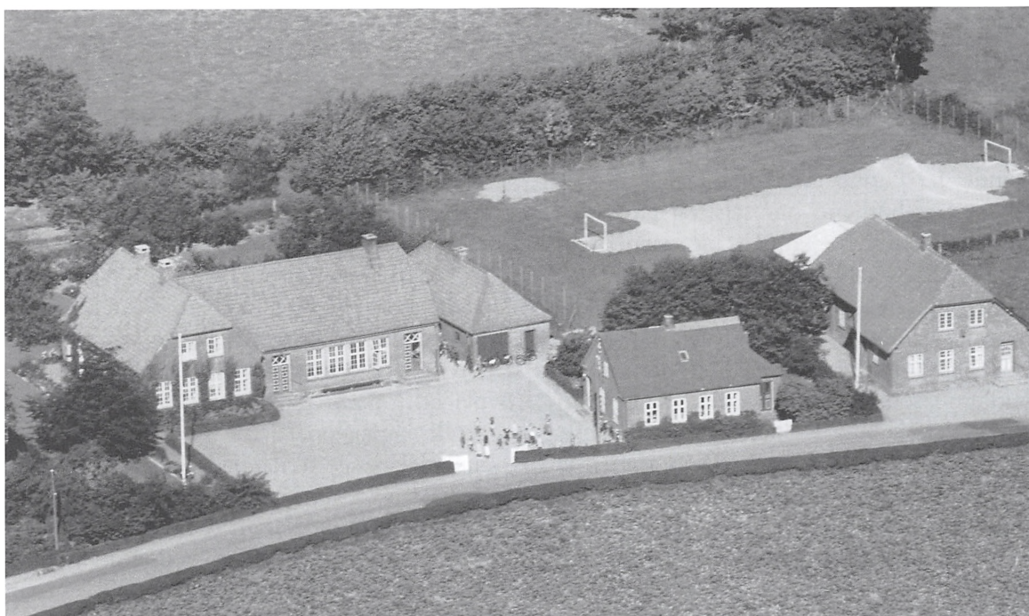
Sdr. Vilstrup Skole i 1955.