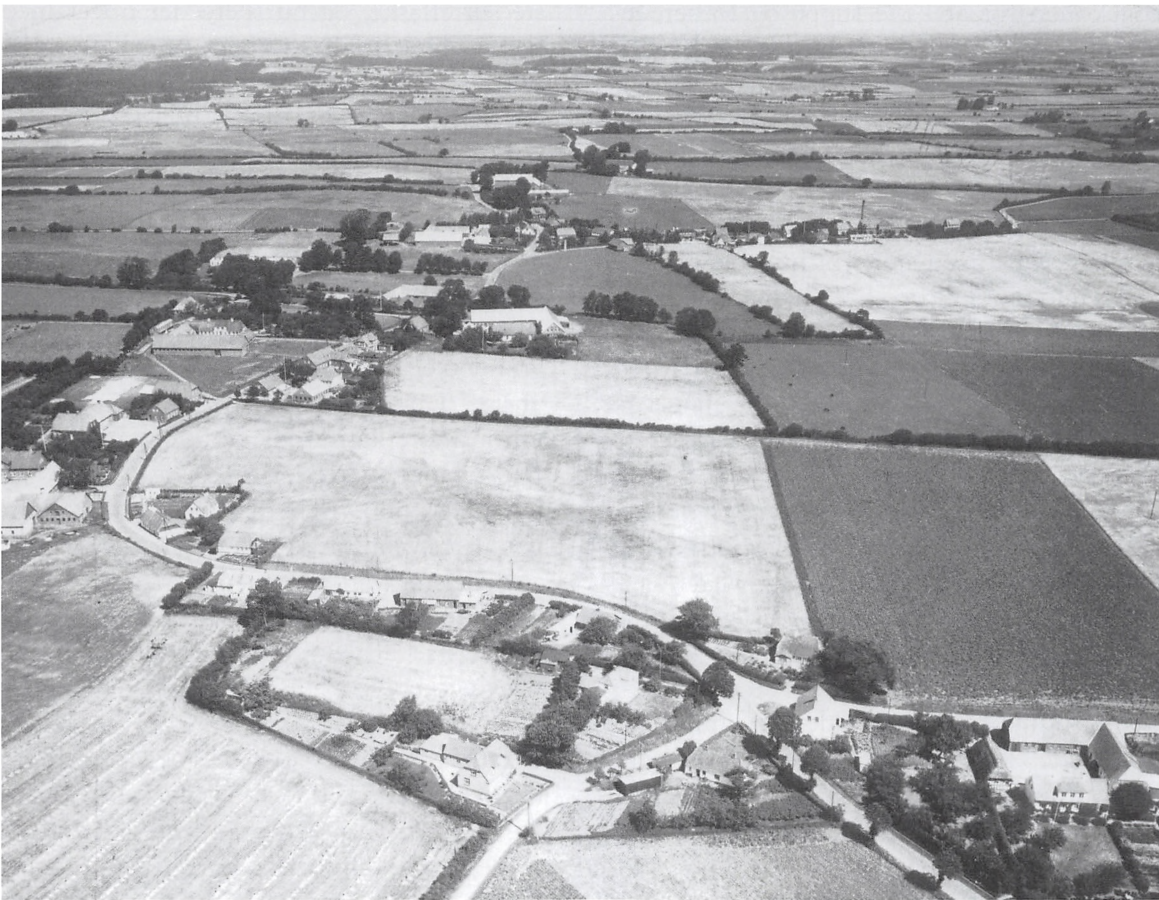
Sdr. Vilstrup i 1955. Bagtvedgård ses til venstre i billedet.