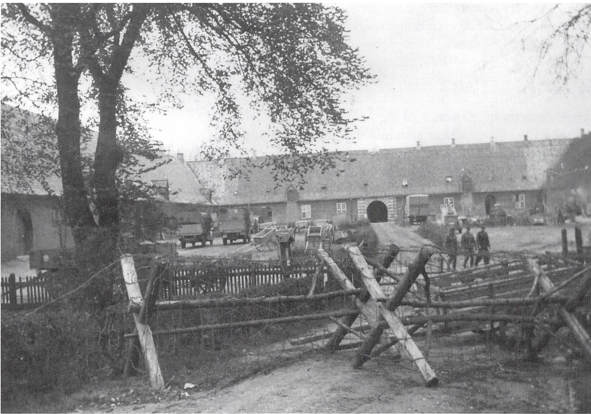
Koldinghus Staldgaard under besættelsen.