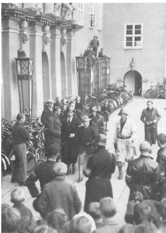
Scene fra Domhuset den 5. maj 1945, hvor modstandsfolkene mødtes.

Jeg tror nu ikke, man fangede nogen af de "store", som Kolding jo var rigt forsynet med. Både Staldgårdens Gestapofolk og "Peter-gruppens" Koldingafdeling overnattede 4.-5. maj på Staldgården. Senere blev de fleste arresteret i Danmark og Tyskland, men det var først flere dage efter befrielsen.