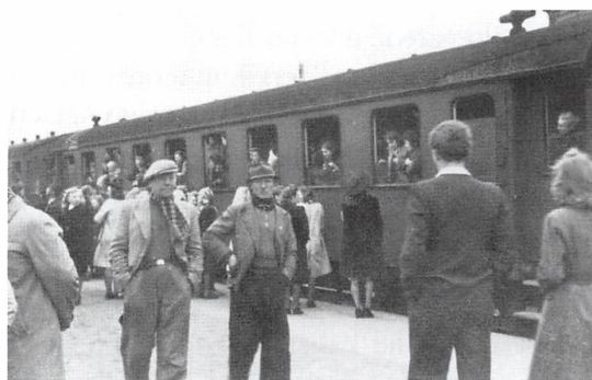
Franske kvinder på vej til Sverige på Kolding Banegård.

Det var i pinsen 1945, da jeg var på ferie i Aabenraa. Jeg så en tysk krydser "Nürnberg" komme ind og lægge til. Det var et meget smukt skib, men jo tættere det kom, jo mere