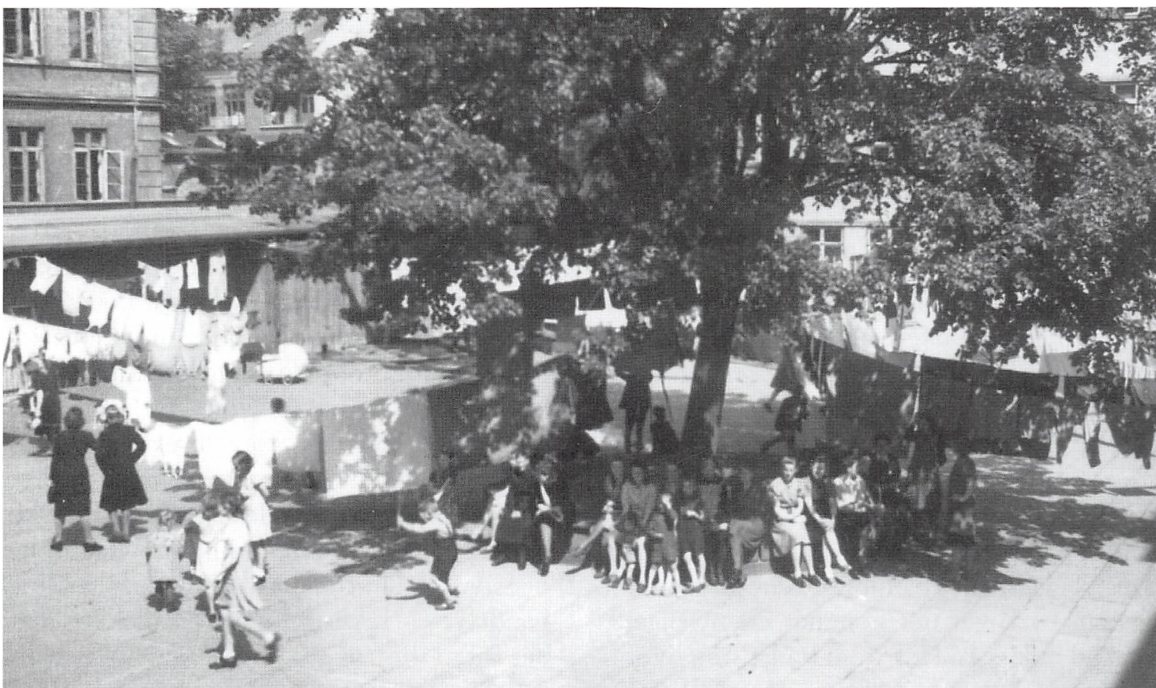
Tyske flygtninge i Almenskolens gård under krigen.