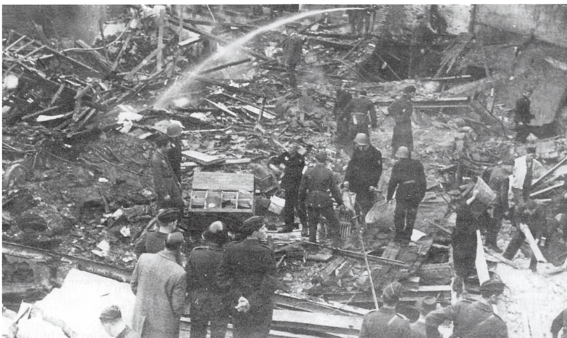
Efter schalburtagen på Kolding Folkeblad 16. september 1944.