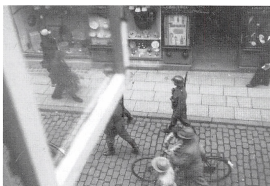
Tysk patrulje i Adelgade under undtagelsestilstanden i august 1943.