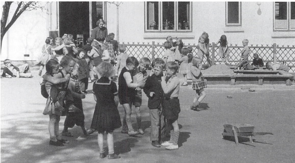
Børnehavens legeplads, ca. 1950.

en dagbog blev registreret antallet af børn pr. dag, årsag til forsømmelse osv.