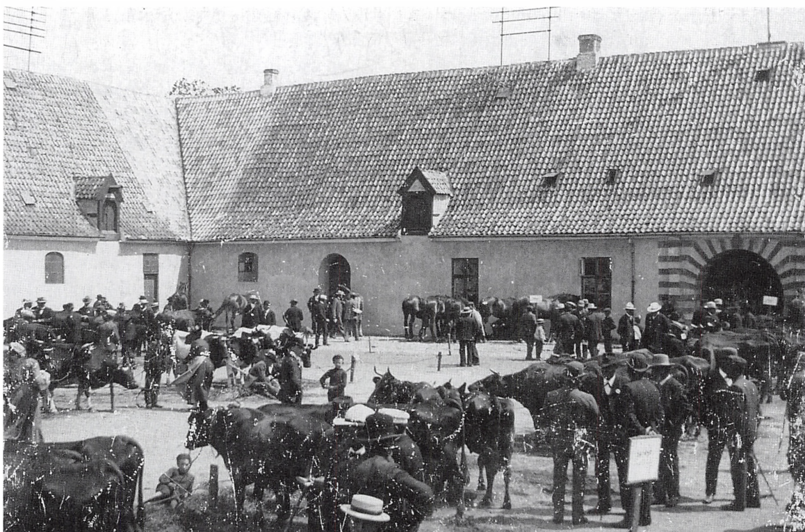
Heste- og kreaturmarked i Staldgården i 1890erne.