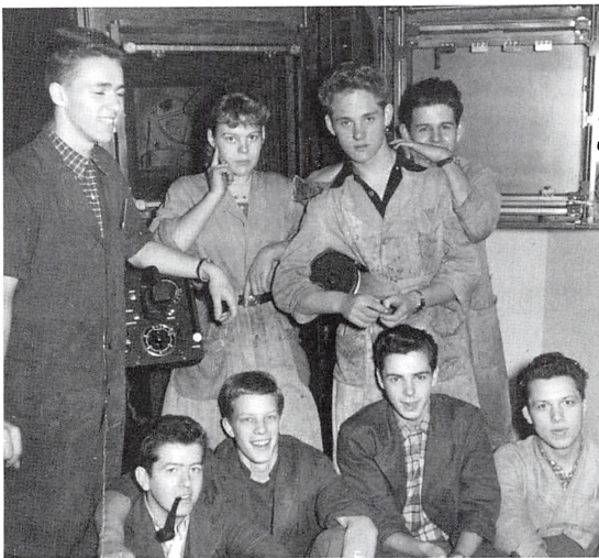
Fagskolen i København 1955. Eleverne står foran det store reproduktionsfotografiapparat.