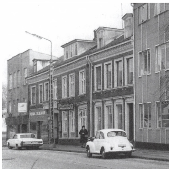
Mazantigade i 1972. De to huse fra venstre er Jyllands Clichéfabrik. I huset længst til venstre var der rammefabrik og salg af billeder. Clichéfabrikken var på 1. og 2. sal.

Arbejdstiden var fra kl. 7.00-17.00 med 1½ times middag. Jeg cyklede hjem i middagspausen, ca. 4½ km hver vej, men selvfølgelig skulle jeg hjem, for min mor var god til at forkæle mig og diskede op med ristet