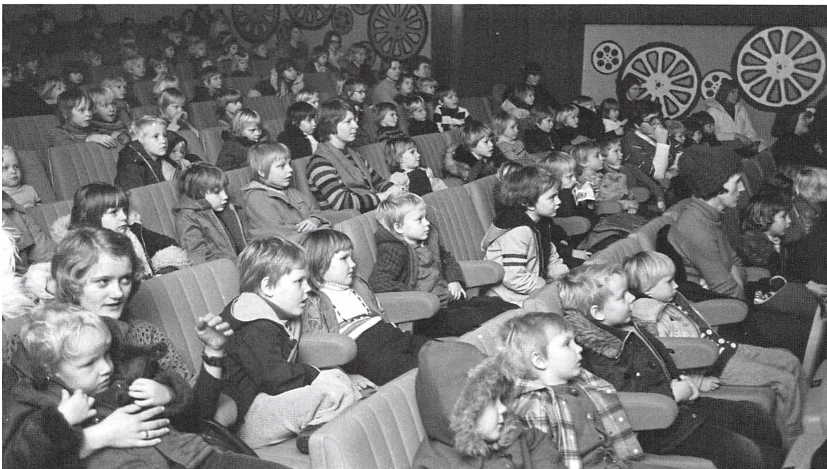
Børnehavebørn til forpremiere på "Dunderklumpen", en svensk tegnefilm, der blev spillet i Biografen 1+2 i januar 1976.

filmudlejerne i ed, og disse var absolut ikke tilhængere af særlige rabatter til medlemmerne af en for dem ligegyldig bogklub. Lademann havde ikke KINO i mere end godt et års tid, før den igen blev udbudt til salg, og på det tidspunkt havde den kostet ejeren et kæmpeunderskud, så den kunne købes billigt. Den overtog jeg så i 1978 og iværksatte en stærkt påkrævet opfriskning af de ret dystre lokaler. Dermed havde jeg en konkurrent mindre, men kombinationen af den gamle nedslidte og megastore biograf i Søndergade og de to mindre i Jernbanegade med smeltevand i operatørrummet var stadig ikke optimal set ud fra et driftsmæssigt synspunkt. Da frustrationerne i Jernbanegade efterhån-