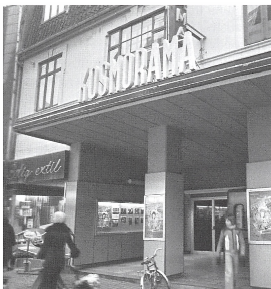
Kosmorama i Østergade som den så ud i januar 1977.