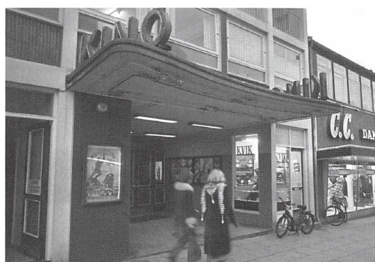
KINO i Søndergade i januar 1977.