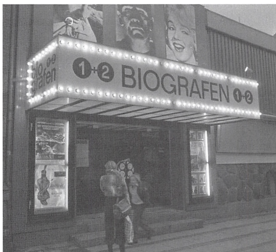
Biografen 1+2 fotograferet i januar 1977 af Kolding Folkeblads fotograf Peter Thastum.

Jeg havde længe været på udkig efter et egnet sted at lave en ny biograf, og en dag fik jeg et praj om, at den gamle og hæderkronede Restaurant Trocadero-Palmehaven nok stod foran lukning, og at lokalerne måske kunne lejes. Den 14. januar 1975 åbnede jeg så BIOGRAFEN 1+2 i disse lokaler. Som nav-