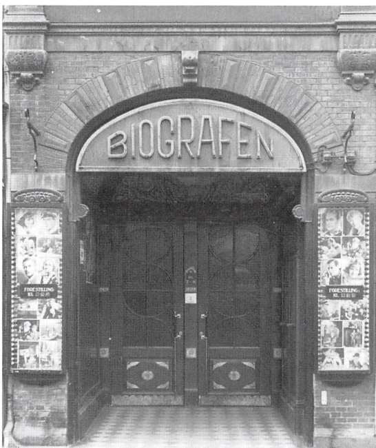
Biografen, Helligkorsgade 14 som den så ud i 1950'erne.

bage at ønske selv den gang. Biografens maskiner havde store problemer med at vise et billede, som bare var nogenlunde skarpt i både billede og undertekster, og selve biografens salen var lille og skummel med hessianbeklædte vægge og stole, hvor "polstringen" udgjordes af et stykke "kunstlæder" monteret direkte på det hårde træ. Om vinteren blev salen opvarmet af en stor kakkelovn, som stod midt i foyeren, og med et sindrigt system blev den varme luft så blæst ind i biografens salen gennem et hul i væggen lige ud for 13. række i højre side. En mindre trænet biografgæst, som havde været så uheldig at købe netop denne yderplads, kunne efter forestillingen føle sig som en grillkylling, som