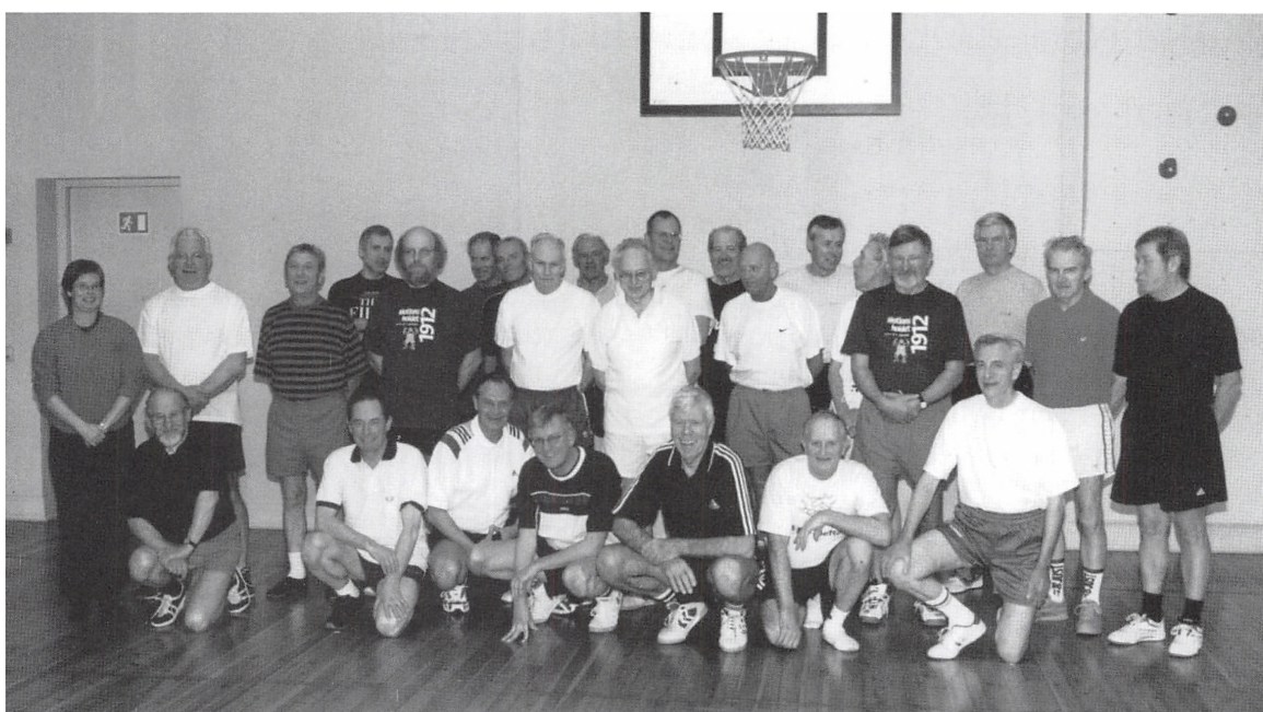
Motionsholdet i 2002.

Niels Bukhs Ollerupgymnastik. Kaptajn Jespersens stavgymnastik satte også sit præg på gymnastikken i tiden op til 1950'erne.