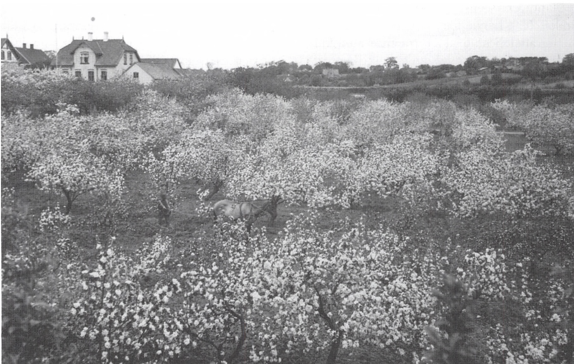
Havebo med æbleplantagen foran.