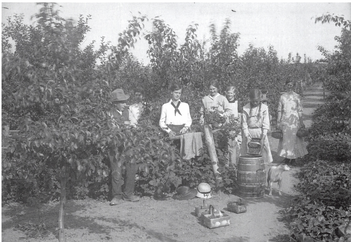
Hindbærplukning ca. 1920.

Under krigen 1940-45 var der gyldne tider for frugtplantagerne. Alt kunne sælges til