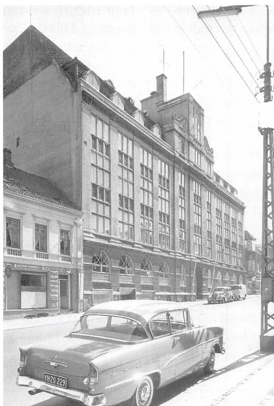
"Borgen". Nordisk Solar, Haderslevvej 25. Foto fra ca. 1960.

Kolossalbygningen "Borgen" lå ud til Haderslevvej. På toppen sad sirenen, som hylede hver onsdag og lørdag klokken 12. Her