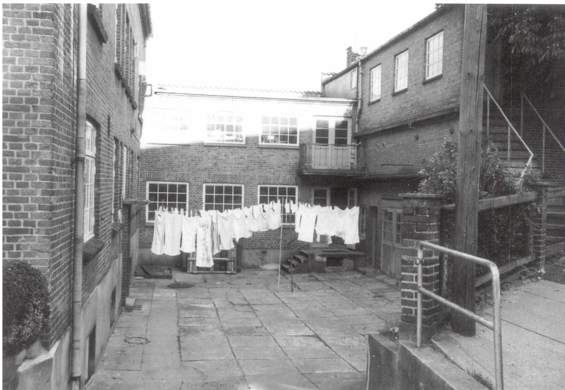
Gården bag Karolinegade 4. Foto i Teknisk Forvaltning, 1972.

menneskeligt hensyn lod dem bo meget billigt, fordi de var fattige. Jeg aner ikke en gang, hvad de hed. Endelig boede der en fraskilt ældre mand, Knudsen, på et værelse, hvor der kun var en håndvask. Skulle han bruge toilettet, skulle han fra anden sal ned i kælderen. Mor havde som barn leget med hans datter. I kælderen havde hver lejlighed et kælderrum til brændsel og et til viktualier. Der var et badeværelse, som man kunne bruge en gang ugentligt. Her stod en stor tromlekakkelovn til opvarmning af badevandet, og der var et badekar. Når mor fyrede op,