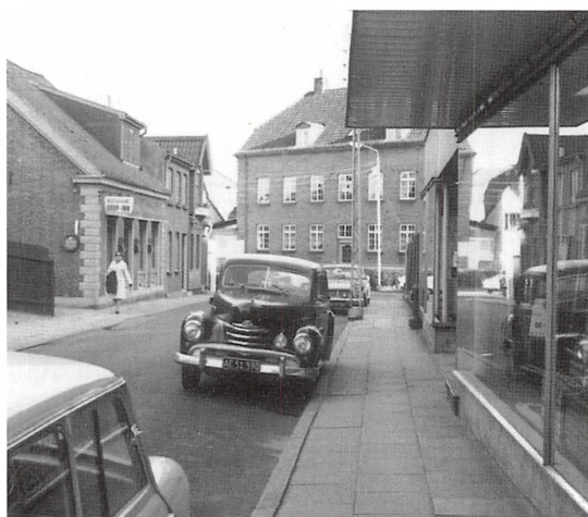
Karolinegade set fra Haderslevvej.