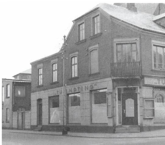
Forretningen "Tusindting", Haderslevvej 17.