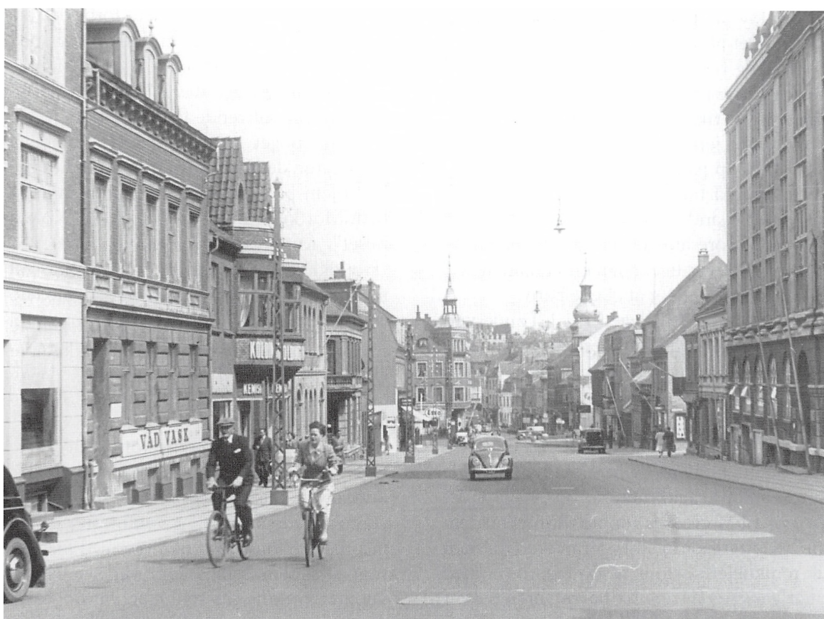
Haderslevvej i begyndelsen af 1950erne.