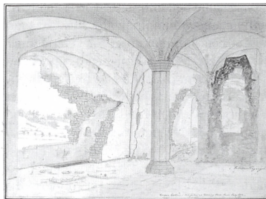
Fabritius Tengnagel: Kongens køkken i det indre af Kolding Slotsruin, juli 1834.

Allerede den 1. april har Ribe Stifts Tidende en historie, der er fuldstændig identisk med den, der står at læse i Dagen og Ber-