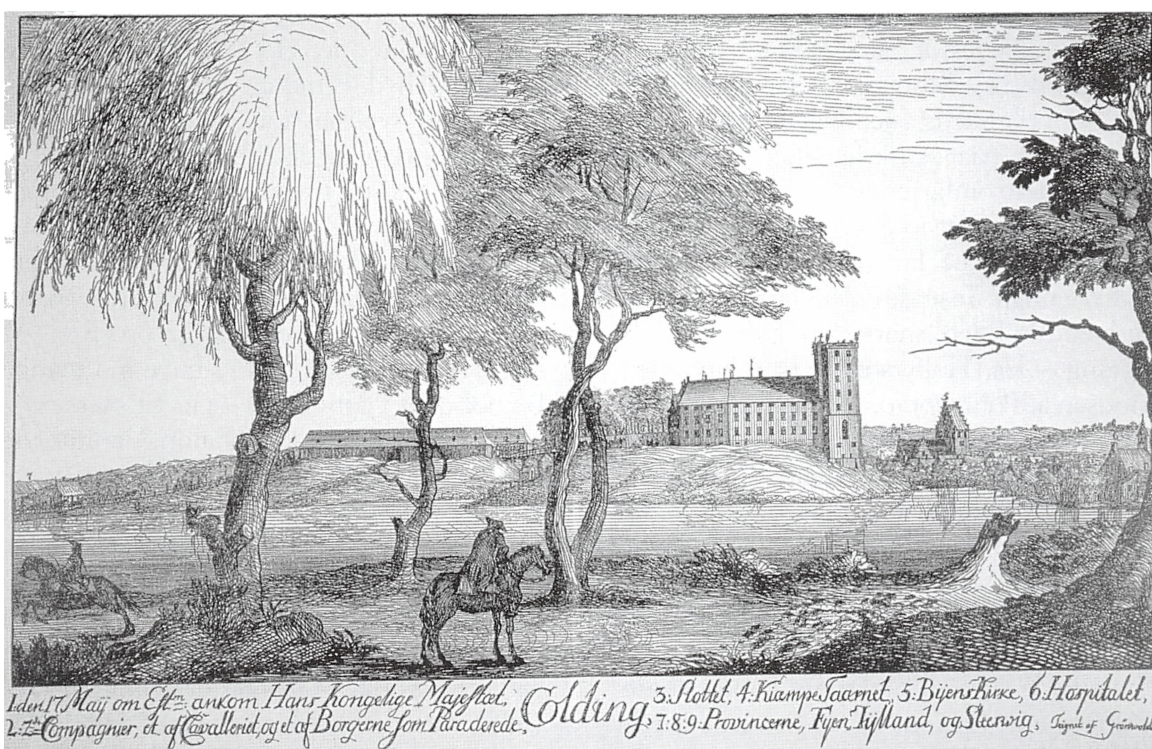
Koldinghus som det så ud før branden. Grønvolds tegning 1746.

I dette Øjeblik faldt den ene Side af Muren paa Kæmpetaarnet ned, og har formodentlig slaaet Hvelvingen i den skjønnne Kirke i Stykker. Det beklageligste herved er, at en stor Del Magasinkorn maaskee herved gjøres umulig at redde, som dog ellers vilde have blevet Tilfældet. Om der er blevet noget Menneske ihjelslaget ved Murens Nedstyrtelse, ved man endnu ikke. Imidlertid synes al Fare for Ildens videre Udbredelse at være forbi”.