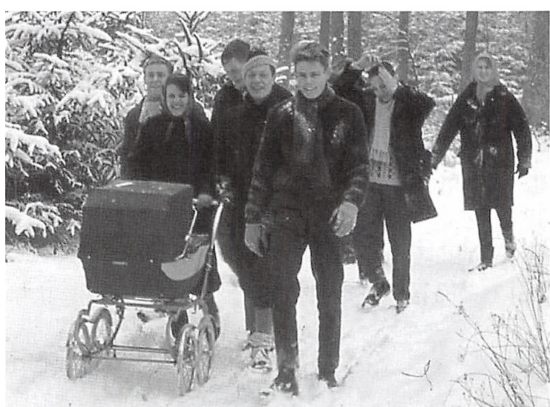
Traveture hørte med til KU's aktiviteter. Her ses fortroppen på en vintertur.