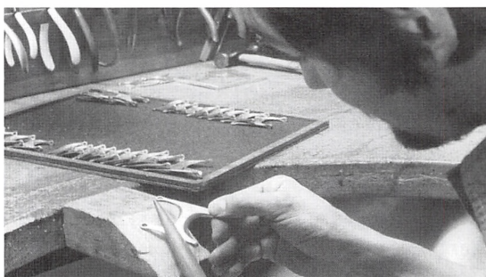
Øverst: På uvalgte guldplader, ca. 2 mm tykke, aftegnes kædens enkelte led, hvorefter de savnes ud. Nederst: kædeleddet files, indtil den ønskede form er opnået.

heden, er det bemærkelsesværdigt at kunne konstatere, at Københavns Kommune, landets største, mest betydningsfulde, ikke ejer nogen og har aldrig ønsket at besidde en slig genstand. Derom senere, idet emnet her i denne artikel inspirerer til endnu en gang at foretage et lille sidespring, nemlig en kort omtale om emnet kæde i bredere forstand.