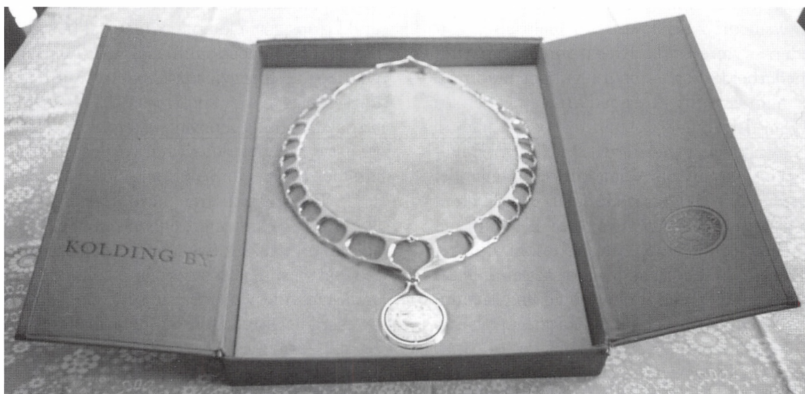
Her ses Koldingkæden udført af Hans Hansen Sølvsmedie og tegnet af Bent Gabrielsen, liggende i det fornemme gedeskindsetui fremstillet hos københavnerbøgbindermesteren Ole Olsen.

De i alt 26 led på kæden er formet som versal H'er, hvis ben er samlet med kædeøskner. Alle led er savet ud af udvalgte, ca. 2 mm tykke 14 karats guldplader. H'ets tværgående midterbjælke er udført med svaj, således at leddene samlet danner, hvad man nærmest kunne betegne som en række superelipser. På kædens smalleste steder (skulderpartierne) er bredden 2,6 cm, på rygmidten 3,2 cm og fortil, der hvor medaljen er ophængt, er bredden 4,0 cm. Den samlede kæde måler indvendig 29 cm i bredden og 30 cm i højden og er altså nærmest cirkulær, men