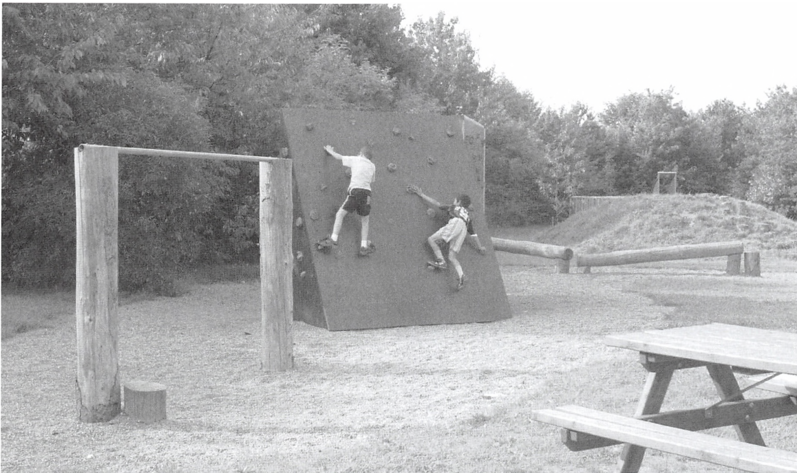
Aktivitetstien på „Den Grønne Linie“, 2001.

ne på Junghansvej/Knud Hansensvej – hvor der skulle være aktiviteter og mulighed for overnatning, idet man vidste, at mange børn i området ikke kom på ferie. Selve samarbejdet i planlægningsfasen mellem beboere og forvaltning var spændende, idet kvarteret var kendt som et område, der var „svært at komme ind i“ som familiekonsulent. Beboerne kunne – set udefra – nok have problemer, men til gengæld var der også et tæt netværk og tendens til „at holde tæt“ og ikke be' om hjælp – især ikke fra en Socialforvaltning. Det fælles ønske om at lave noget godt for børnene overvandt imidlertid tendensen til at holde afstand, så projektet blev en succes.