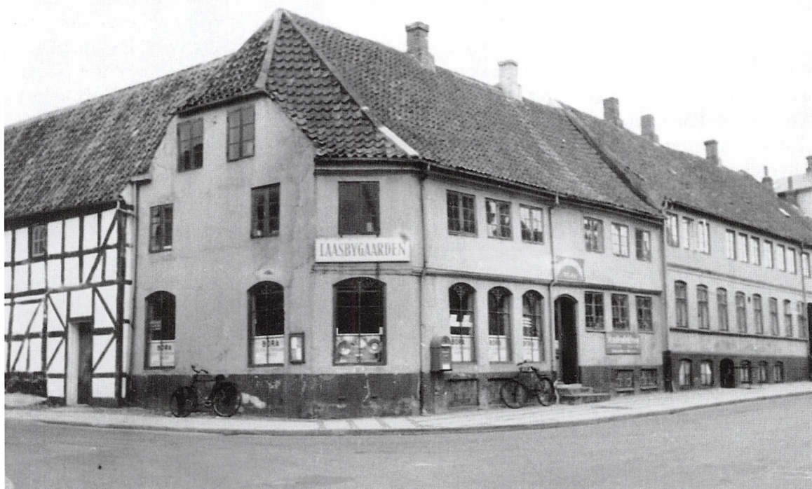
Låsbygården, nu kaldet Borns Gård, i 1956.