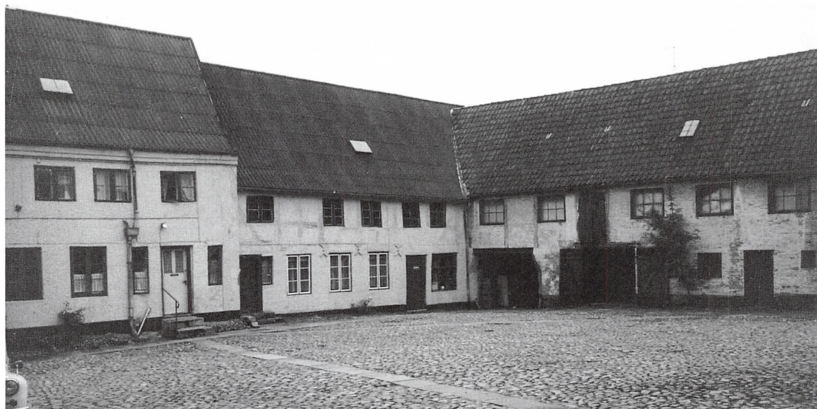
Låsbygården, nu Borns Gård, set fra gården 1972.

Farfar var medlem af Frimurerlogen gennem mange år, men ellers kender jeg ikke meget til hans voksenliv. Han var ikke en farfar, man sad på skødet hos. Jeg husker ham tydeligt som en lille, rund mand, altid med en cigarstump mellem læberne, ofte med alpehue på hovedet og altid med stok. Når jeg mødte ham i Låsbygården, fik jeg et venligt klap på hovedet og et „goddag-lille-ven“. Og det var så det. Billeder fra familiebegivenheder viser ham som en munter mand, men ellers var han vist ikke en mand af mange ord. Det var min farmor, jeg havde kontakt med, og hun var en meget varm og favnende dame, altid god for en småkage og en 25-øre til en is. Hun døde som 89-årig i 1978 og