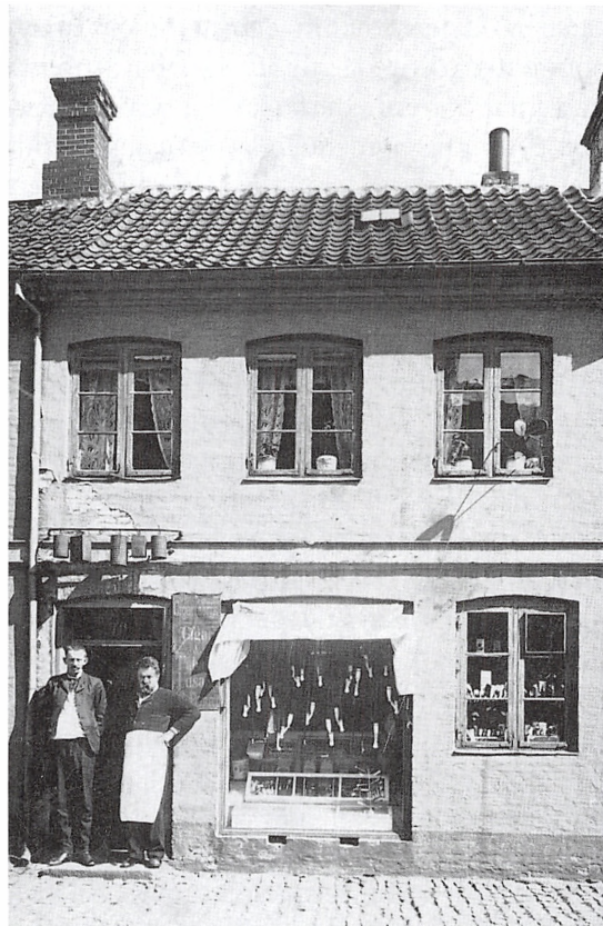
Butikken/cigarfabrikken, Låsbygade 70.