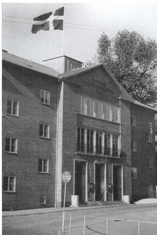
Kolding Biblioteks facade mod Fredericiagade. ca. 1940.

En typisk arbejdsdag begyndte med, at alle afleverede bøger fra dagen i forvejen skulle sættes på plads på hylderne i udlånet. Det kunne Eva og jeg som regel nemt nå, inden vi lukkede op kl. 10, og skranken skulle også gøres klar til at modtage lånerne. Man afleverede bøgerne på den ene side og fik udleveret bøger på den anden side af den hesteskoformede skranke, som befandt sig på 1. sal, hvor der i dag er vejledningskranke.