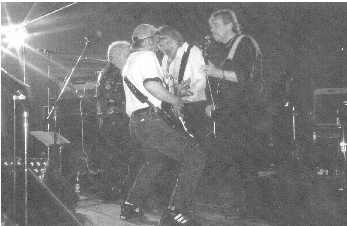
Red Mustangs i action med Rockin' All Over The World i Nordfynshallen i 1996.

Siden Tresserrockfestivalen startede i Kolding, har det altid været kutyme, at det var Red Mustangs, der spillede som det sidste orkester på den tolv timer lange festival. Årsagen hertil har været, at Red Mustangs med deres vitale spil og legen med scenegimmicks, nemt har kunnet hamle op med deres udenlandske kolleger, når det drejer sig om karisma og personlighed.