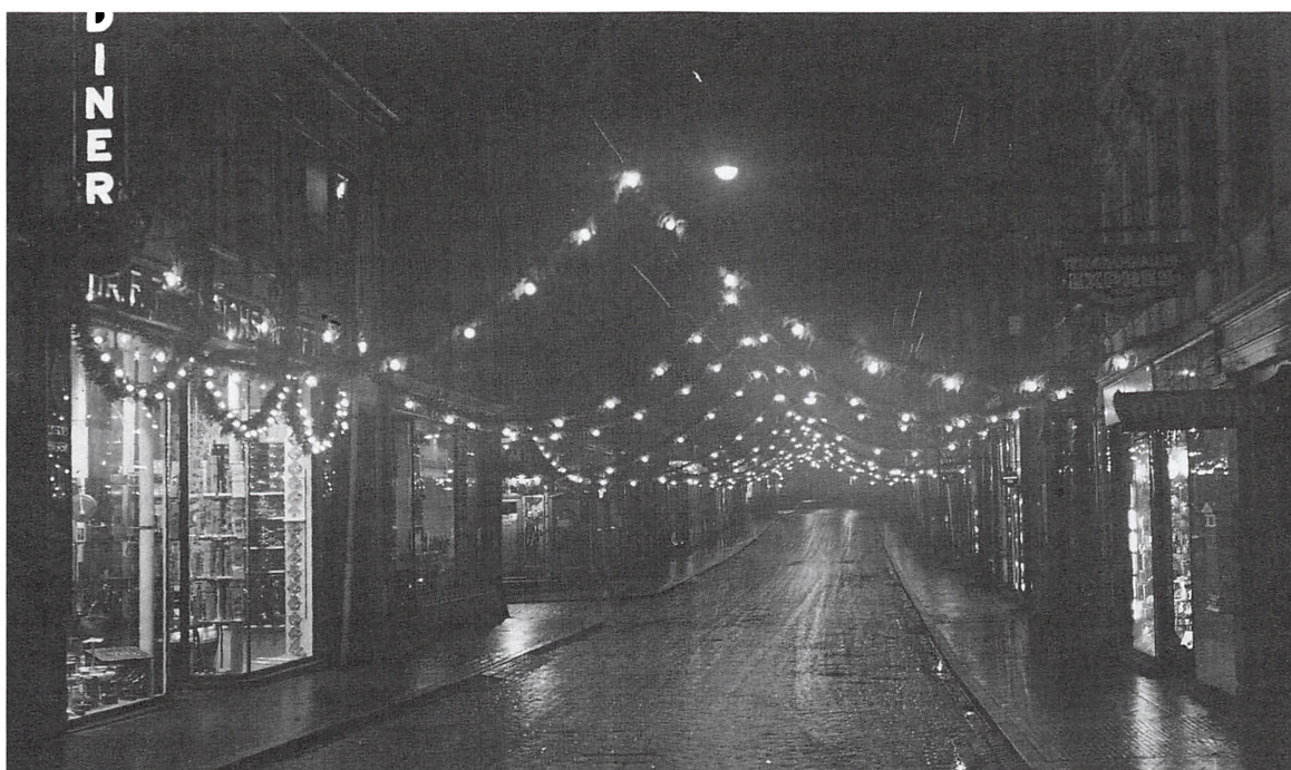
Julebelysning i Jernbanegade i retning mod Rådhuset, december 1930.

I 1930 begyndte der at ske noget mere. Det begyndte med, at en af de Handlende i Jernbanegades øverste Del gik i Lag med at pynte sin Butiks Facade med Gran og Lys, og nu er en