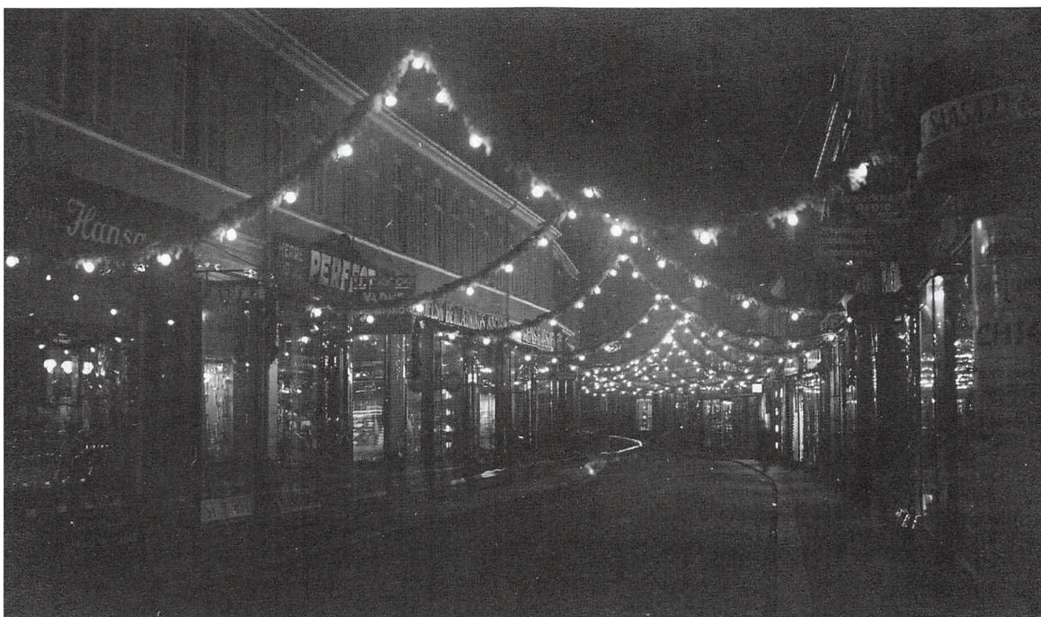
Julebelysning i Adelgade set fra Akseltorv, december 1930.

Var den københavnske Østergade også guirlandeillumineret i 1930? – Ja, faktisk. I Gaar tændtes Julelysene paa Strøget havde hovedstadsavisen Politiken allerede mandag den 1. december 1930 haft som billedoverskrift på forsiden. Kolding Folkeblad bringer den 18.