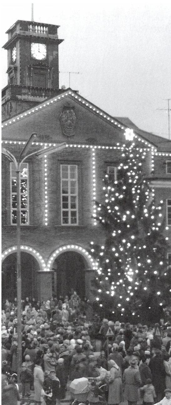
Juletræet tændes foran Rådhuset 1. december 1958.

Buen, er der rejst et juletræ og en mægtig guirlande er spændt hen over den store, åbne plads. Den sydlige side af Jernbanegades brede del har fået guirlander mellem master langs fortovet. Guirlander fra sidste år har fået tilføjet klokker og stjerner. Hvordan mon det går i Paris?