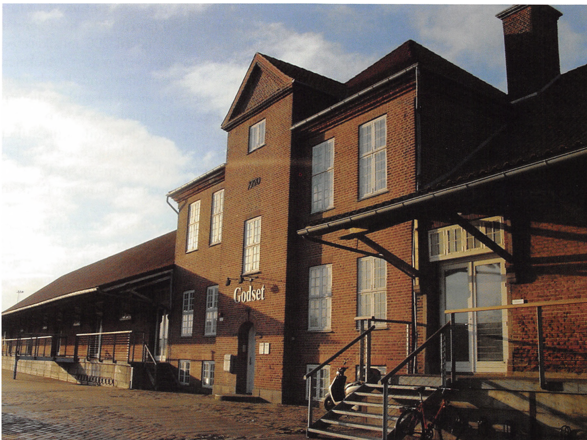
Godsets øvelokaler blev taget i brug i 1997. I 2001 kunne spillested og café indvies.

ambitioner og stor kærlighed til den progressive musik i bred almindelighed.