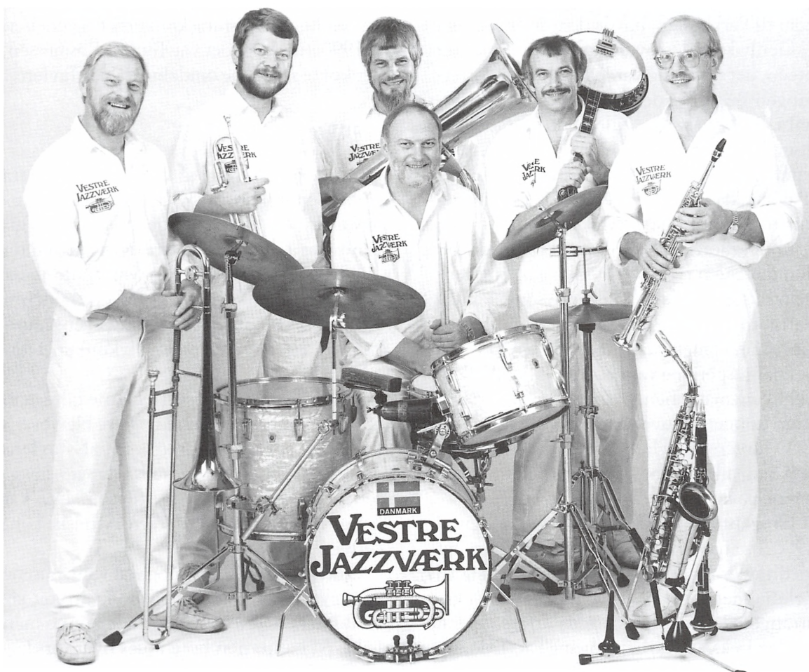
Vestre Jazzværk introducerede frokostjazz på Kridthuset.