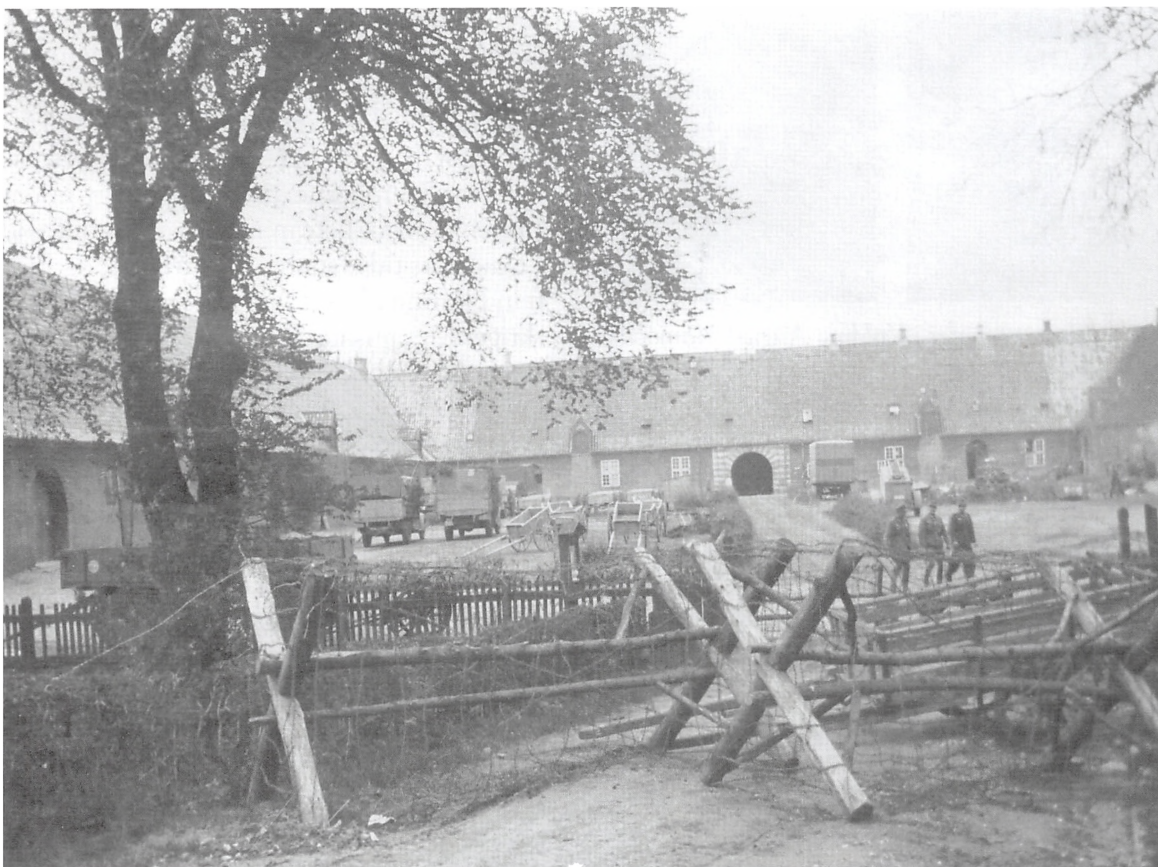
Staldgården besat af Gestapo 1943-1945.