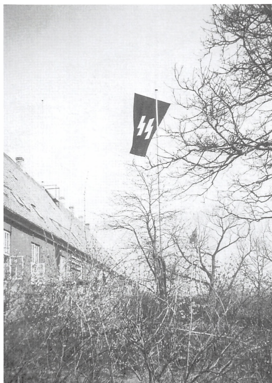
SS-standarten vajede kun en enkelt gang over Koldinghus Staldgård. Det var på Hitlers fødselsdag den 20. april 1944.