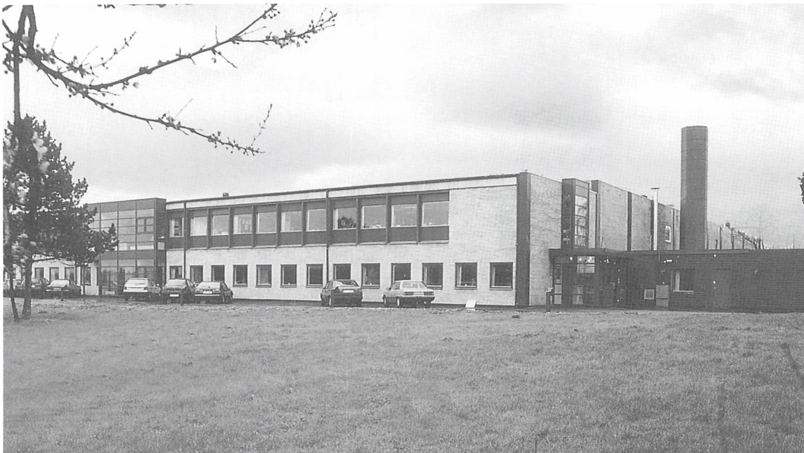
Borks nyindrettede virksomhed i Skartved.

afdeling, ansat på en konkurrerende tavlefabrik, møbelsælger m.v. kom ham her til gode.