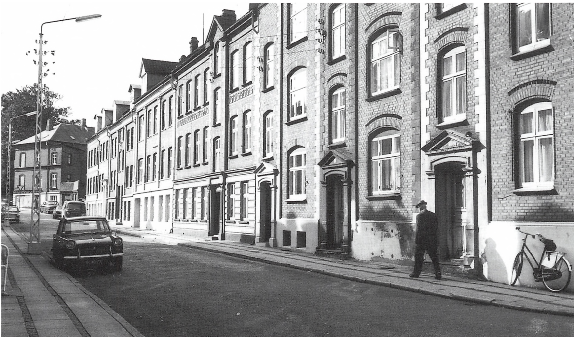
Øverst: Grønnegade med de mange ruder. Slagterens port skimtes lige, hvor vejen krummer. Nederst: Fra en drengefødselsdag i en af Grønnegades baggårde i midten af 1940'erne.