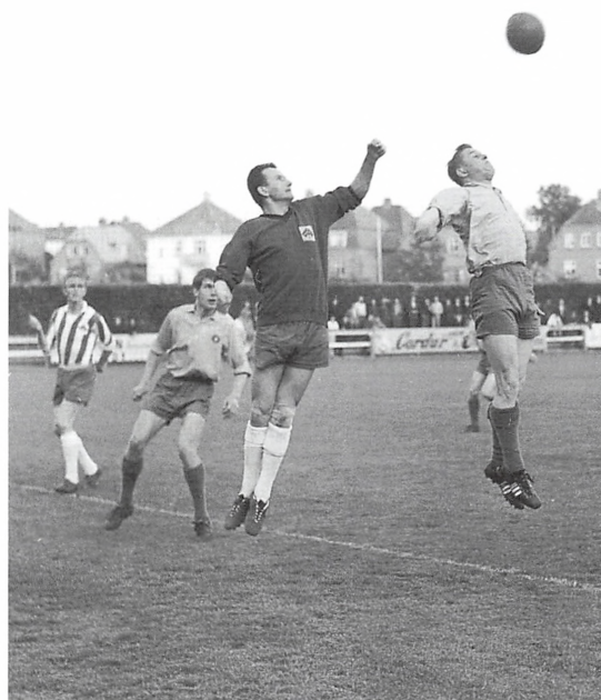
Fodbold på Kolding Stadion omkring 1960.

At ingen omkom under de panikagtige scener, der fulgte, da folk sloges om at komme først ud af stadion, er egentlig ubegribeligt. Folk løb, cyklede og bilede i hæsblæsende tempo gennem tågen ind gennem byen, hvor de få søndagsvandrere sprang ind i opgangene af skræk. Var det russerne, der var på vej eller hvad? Ingen evakueringsplaner i tilfælde