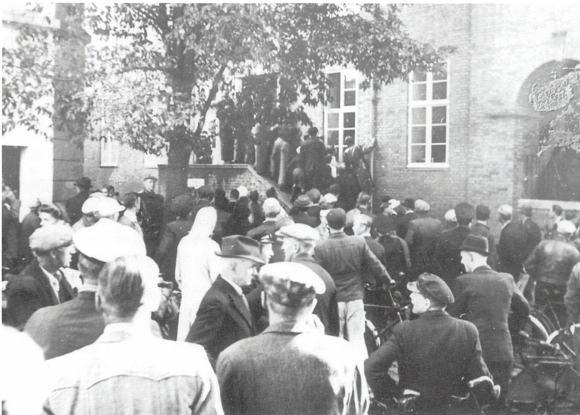
Mennesker samlet ved Kolding Rådhus for at følge sagen om pryglestraffen, den 29. september 1944.

man kunne idømme fængsel. Små sager, som fuldskab og gadeuorden, blev ofte klaret på stedet mod, at man betalte eksempelvis 20 kr. til Børnebespisningen. Det blev til ganske mange penge, Vagtværnet således skaffede til et godt formål.