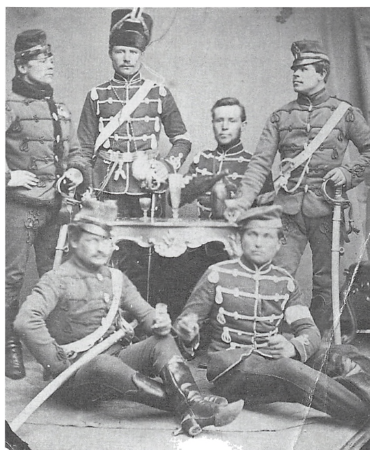
Preussiske husarer i Kolding i 1864.

Den anden slesvigske krig var forbi, og vore danske landsmænd i Slesvig kom under fremmed herredømme – de skulle være preussere. De er ikke blevet det endnu, og de bliver det ej heller foreløbig. Men de er vedvarende preussiske undersåtter, og udsigterne til, at det skal blive anderledes, er ikke store.