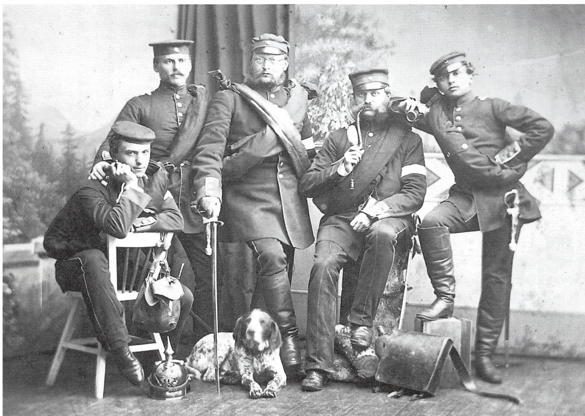
Preussiske underofficerer i Kolding 1864.

Den 8. marts begyndte østrigerne deres indmarch i Jylland gennem Kolding. Først rytteri og derefter infanteri, jægere, artilleri og brotræn m.m. Der var meget at se på hele dagen, og tropperne gik gennem byen med fuld musik. Så store musikkorps havde vi ikke set før, men vi fik senere meget af det udmærkede østrigske musik at høre i Kolding i løbet af sommeren, og inden de drog bort i november.