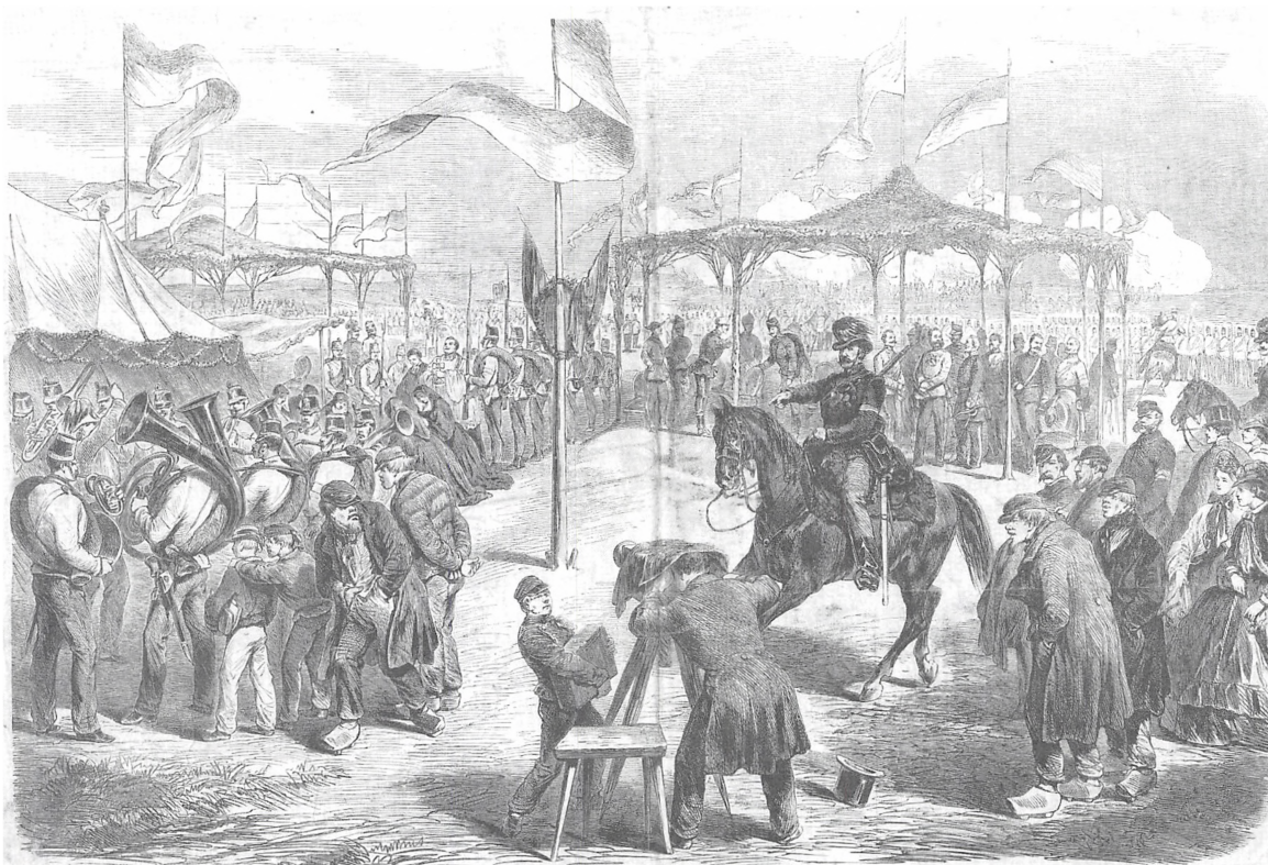
Fejringen af kejser Franz Josefs fødselsdag i det østrigske hovedkvarter i Kolding den 18. august 1864. Illustrierte Zeitung, 17. september 1864.

meget begejstret for den sejlads. Der var vist mange af soldaterne, der aldrig havde set så stort et vand som Kolding Fjord og Lillebælt.