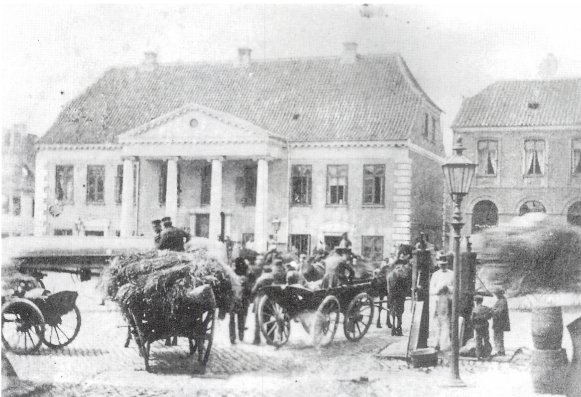
Tyske pontoner, der skulle benyttes til overgangen til Fyn, kører over Akseltorv i Kolding i 1864.

Med geværkolberne opad og hujende og skrigende gik flere batailloner gennem byen. De var jo nu i det fremmede land og ventede hvert øjeblik at komme i kamp. Under gennemmarchen gjorde en del af artilleriet holdt i Låsbygade. Soldaterne gik ind i husene, og vi fik da også besøg af nogle artillerister, der anmodede om at få noget at spise. Moder gav dem smørrebrød med snaps og øl, og da de havde spist, tilbød de betaling, som dog ikke blev modtaget, og da de forlod os, var de meget taknemmelige. Det var de første østri-