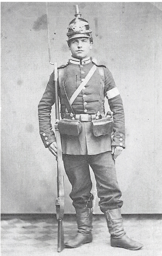
Preussisk infanterist i Kolding, 1864.

Efter at have set vore hårdtmedtagne soldater klædt i islandske trøjer og i mørke- og lyseblå feltkapper – og flere af infanteristerne med træsko – var det helt underligt at se disse stramme preussere rykke frem gennem gaderne.