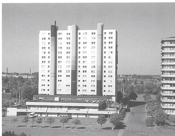
Fjordparken, Kløvervej 33-37, set fra øst.

og nogle flyttede fra de ellers gode lejligheder øverst i højhuset.