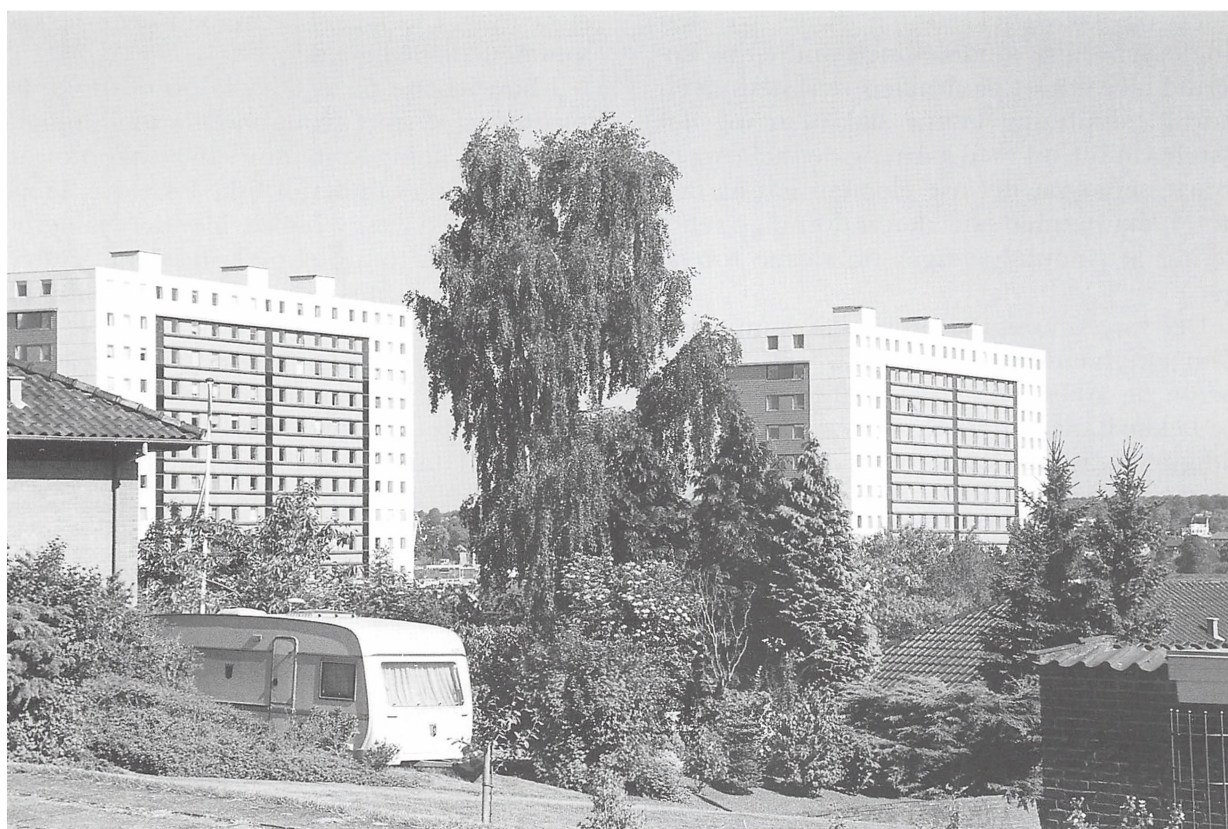
Strandparken fra sydøst. Foto Hans Fjil, maj 2000.

1999. Den hårdt tiltrængte reovering påbegyndtes i samme måned og var færdig 1. april 2000. Det viste sig, at betonreoveringen af altanerne mod vest var mere tiltrængt end beregnet og tog hermed længere tid. Betonen blev repareret og rensat og fik en ny algeskyende maling. Den udvendige reovering, udover altanerne, omfattede nye vinduer med lavenergiruder i østfacaden, gavlene fik yderlige isolering, og der kom nye indgangspartier.