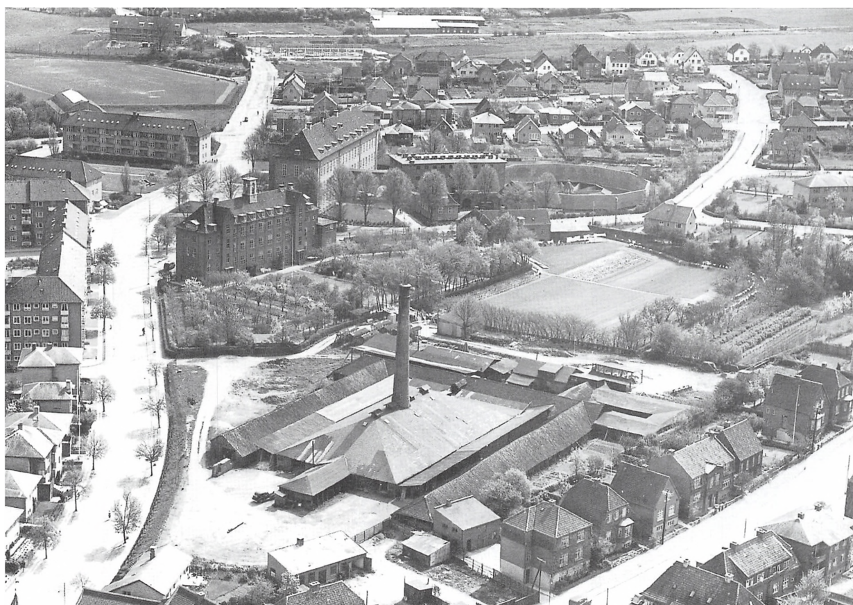
Hollænders Teglværk fotograferet fra luften ca. 1956. Domhusgade ses til venstre i billedet.