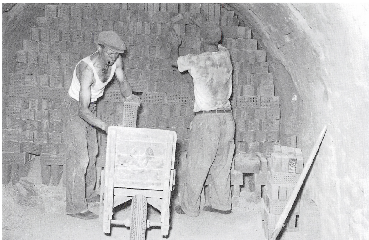
Stenene tages ud efter brænding i ringovnen 1956.

gamle bygninger i Domhusgade for at give plads for et stort nyt supermarked, der først blev drevet af købmand From. Det var Institut for Købmandsetablering gennem Aktieselskabet af 2. februar 1965, der stod bag købet.