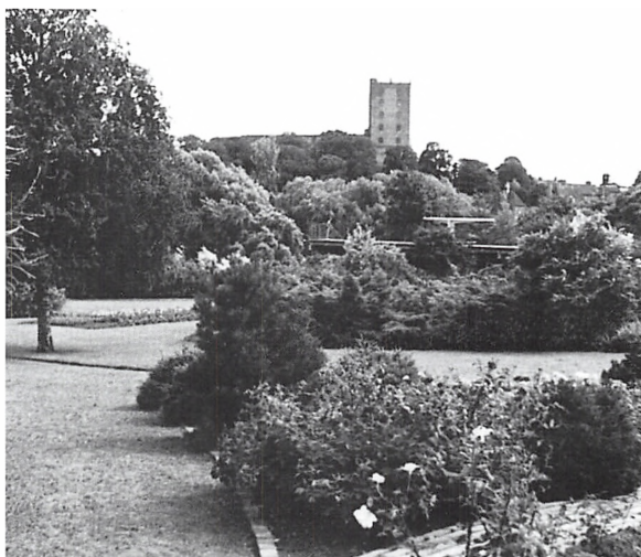
Forevisningshaven i Hospitalsgade. Foto fra ca. 1960.