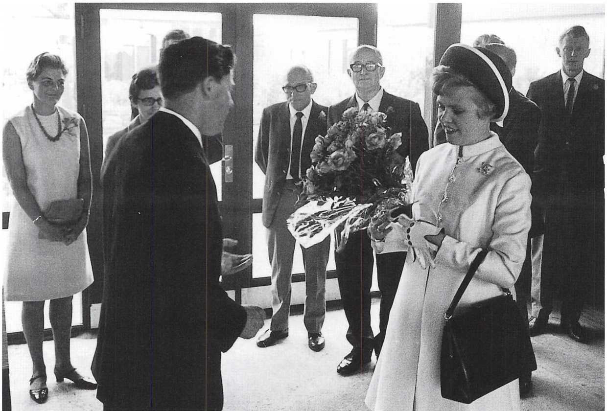
Grevinde Inge af Rosenborg foretog den officielle åbning af Bollerups Plantecenter den 3. september 1968.

Det nye Bollerup Plantecenter på adressen Lærkevej 7 blev indviet den 3. september 1968. Grevinde Inge af Rosenborg, der kort forinden var blevet gift med grev Ingolf og flyttet fra Lyngby til Egeland i Øster Starup, foretog den officielle åbning ved at overklippe en blomsterranke.