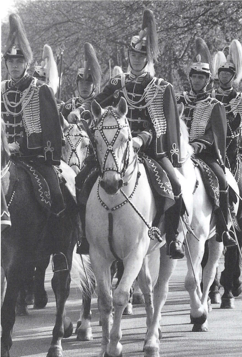
150-året for Slaget ved Kolding 23. april 1849 blev mindet. Der var Garderhusarer på Fynsvej ligesom for 150 år siden.

eningslivets indslag bliver domineret af butikshandelen og ølsalget. Kultur-natten 1999 afvikles 27. august. (3/3, 28/8)