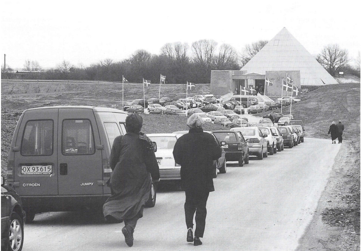
Helsepyramiden med tilbud i alternativ medicin blev indviet med reception 12. marts 1999.