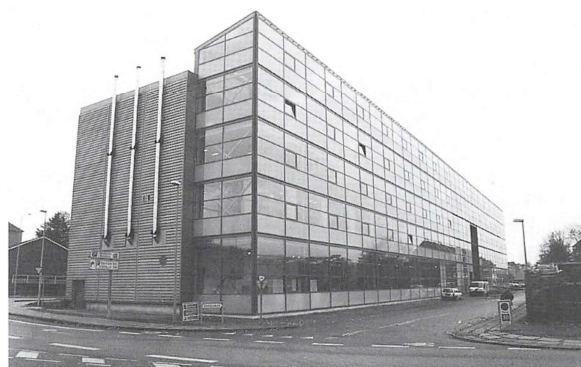
Designskolen Kolding har i dag til huse i "Fabriksgården".

I 1925 oprettedes radiofabrikken Audiola, hvor der i mange år fremstilledes 12.000 modtagere om året. Fabrikationen sluttede, da fjernsynet kom frem.