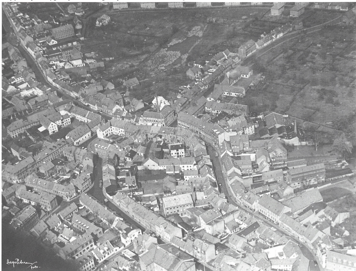
Luftfoto af Låsbygade fra slutningen af 1940'erne.

Jeg var endnu ungarl, da jeg den 1. marts 1944 overtog ejendomsmæglerforretningen,