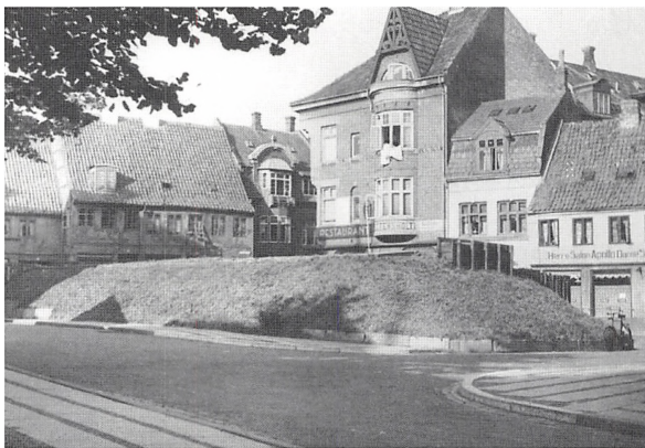
Låsbybanke med beskyttelsesrum.

ligt kunne vi høre den fjerne brummen af de allieredes maskiner på vej ned til Hitler med deres dødbringende last. Vi tænkte på, at det var godt, det ikke var vores hjem, som var målet.