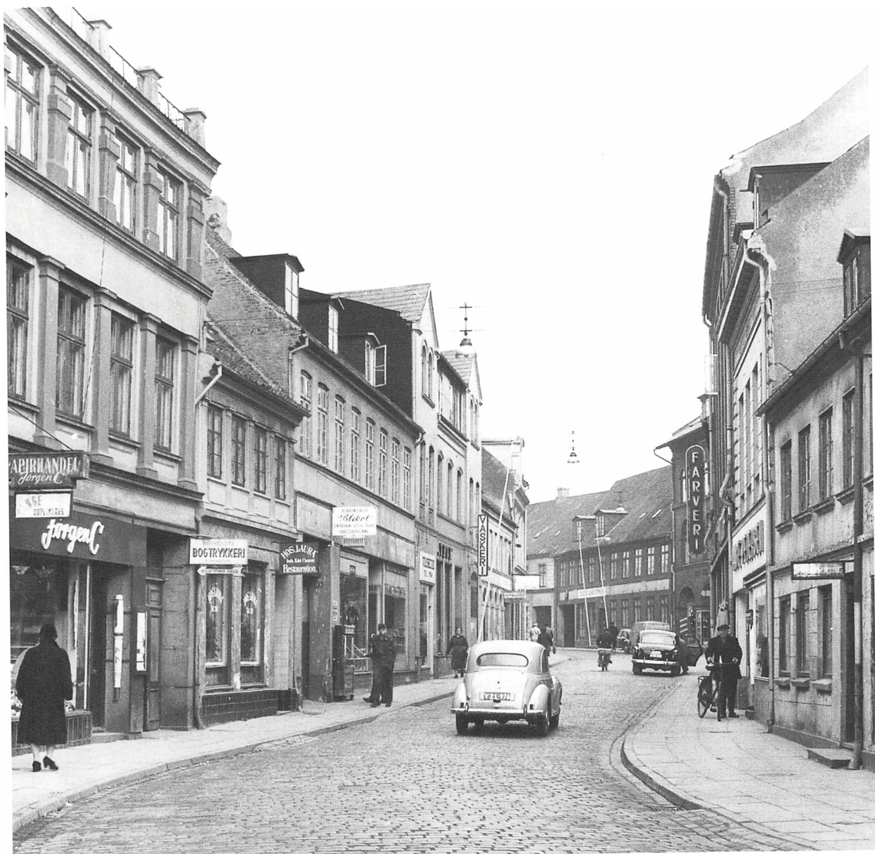
Foto fra Låsbygade ca. 1960.