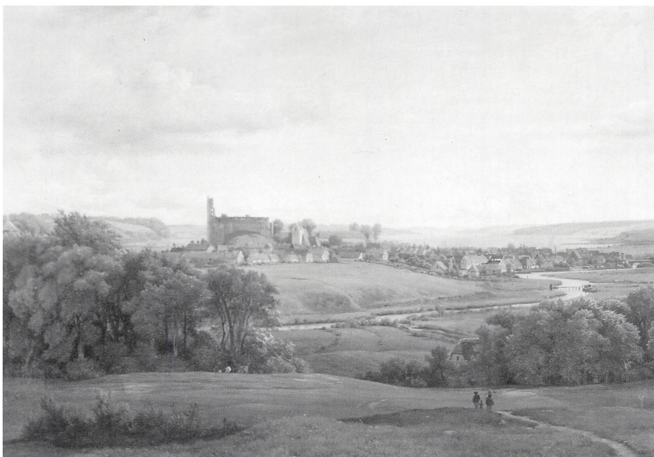
Louis Gurlitt (1812-97): Prospekt af Kolding. Museet på Koldinghus.

godt de kunne, men man manglede stadig inventar – blandt andet »et langt Kar til Badning for usunde Børn«, og oven i det hele kom Napoleonskrigen. I omkring 3 år blev skolelokalerne i stedet anvendt til opbevaring af korn.