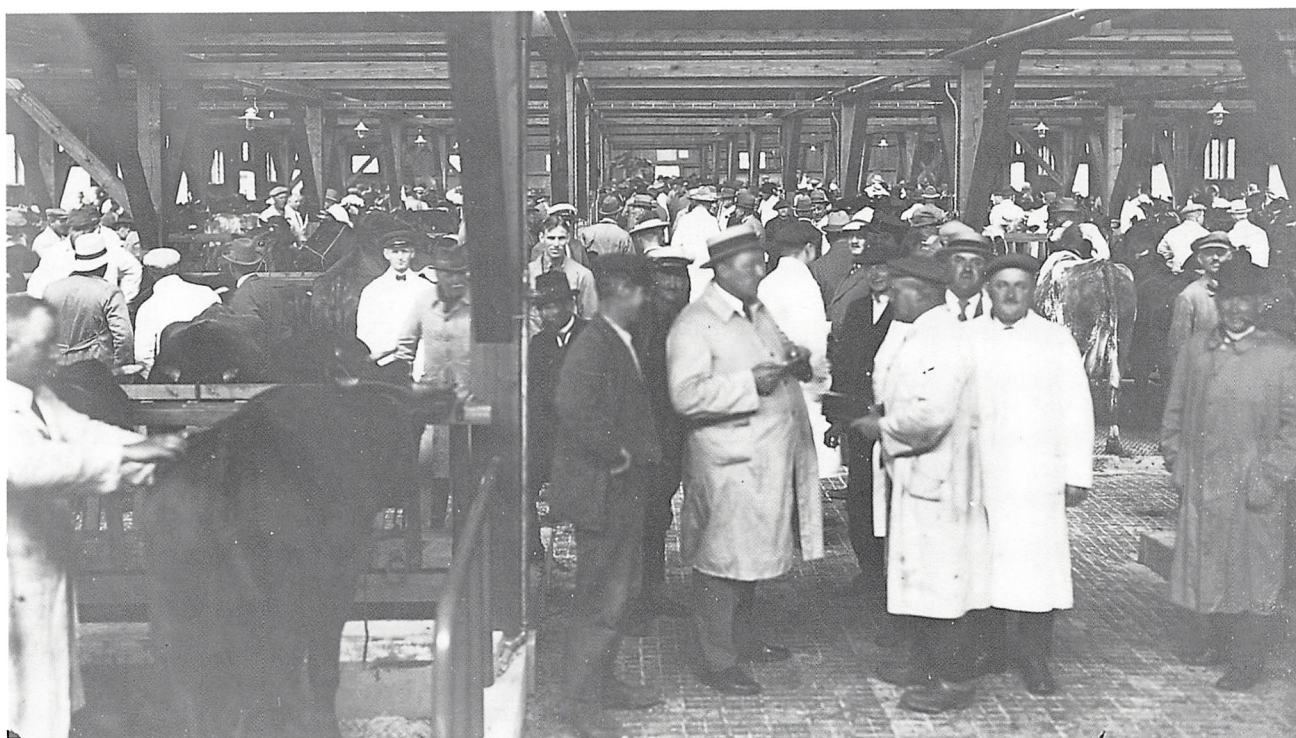
Eksportmarkedet i 1920'erne.