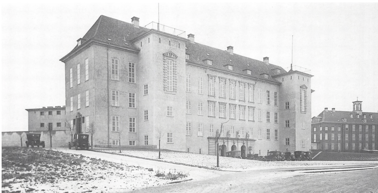
Koldings Domhus, fotograferet ca. 1930.