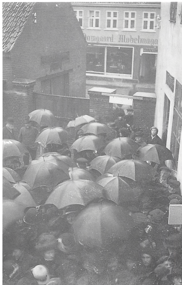
Salg af billige kommunale koks den 22. november 1916.

En aften havde byrådet dog en ubehagelig oplevelse. Sagen om gaspriserne stod på dagsordenen. Det var en aften i oktober 1917, jeg tror den 7. oktober. Da mødet var begyndt, trådte en deputation frem for byrådet og ønskede ordet i en sag vedrørende arbejds- og lønningsforholdene i byen. Jeg sagde til deputationen, at den ikke kunne få ordet her i byrådssalen, men dersom den ville fremsætte sine ønsker skriftligt, skulle jeg bede byrådet tage dem under overvejelse. Hertil sagde de intet, men forlod roligt byrådssalen. Imidlertid samlede der sig efterhånden en stor menneskemasse på torvet uden for Rådhuset. Den blev efterhånden højrøstet og begyndte at bombardere byrådssalen med sten og knuste nogle vinduer i salen. Stenene fløj imod de nedrullede gardiner og nåede ikke ind i salen. Under bombardementet gik et af byrådets socialistiske medlemmer ned og bad om, at stenkastene måtte ophøre. Han tilføjede, »Det er jo os, I rammer«, thi socialdemokrater-