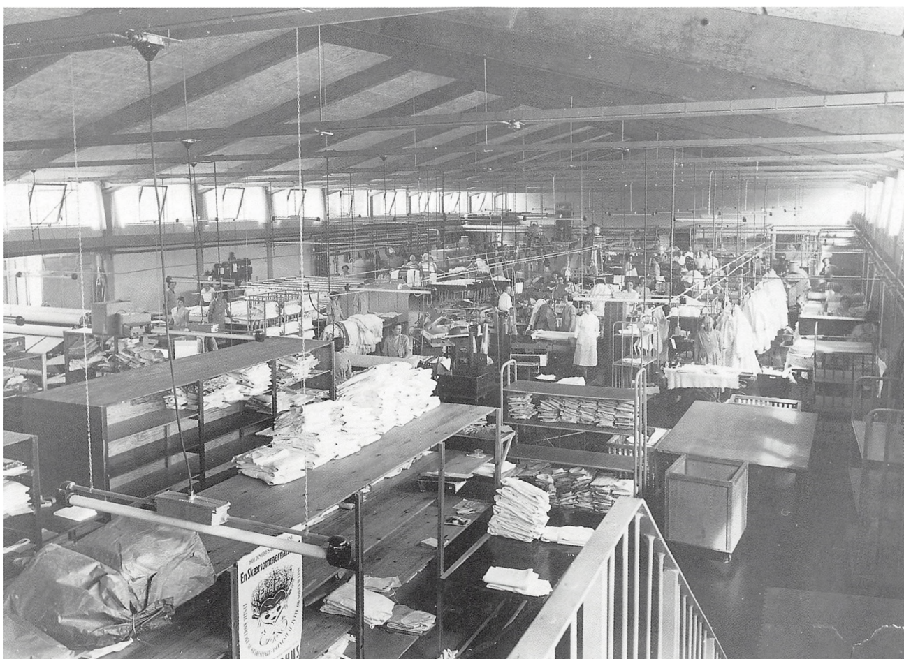
Hallen på Lykkesgårdsvej, ca. 1960.

Med en fortsat tilgang af erhvervs-kunder på leasing/leje-basis udgjorde privatvasken stadig en væsentlig del af produktionen. Men privatvask var besværlig, krævede meget plads og manuel arbejdskraft og var dermed løntung, omkostningsfyldt og beslaglagde en alt for stor del af hele produktionsapparatet. Prisen var efterhånden blevet