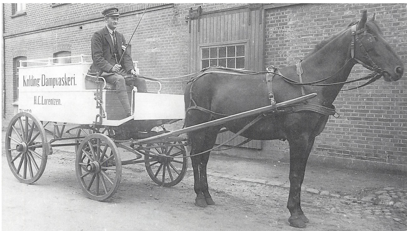
Udbringning af vasketøj. Foto fra 1921.

rystede på hovedet over den astronomiske købspris, ligesom nogle gav udtryk for, at den gode herr Frøkjær kunne have været trykket på prisen.