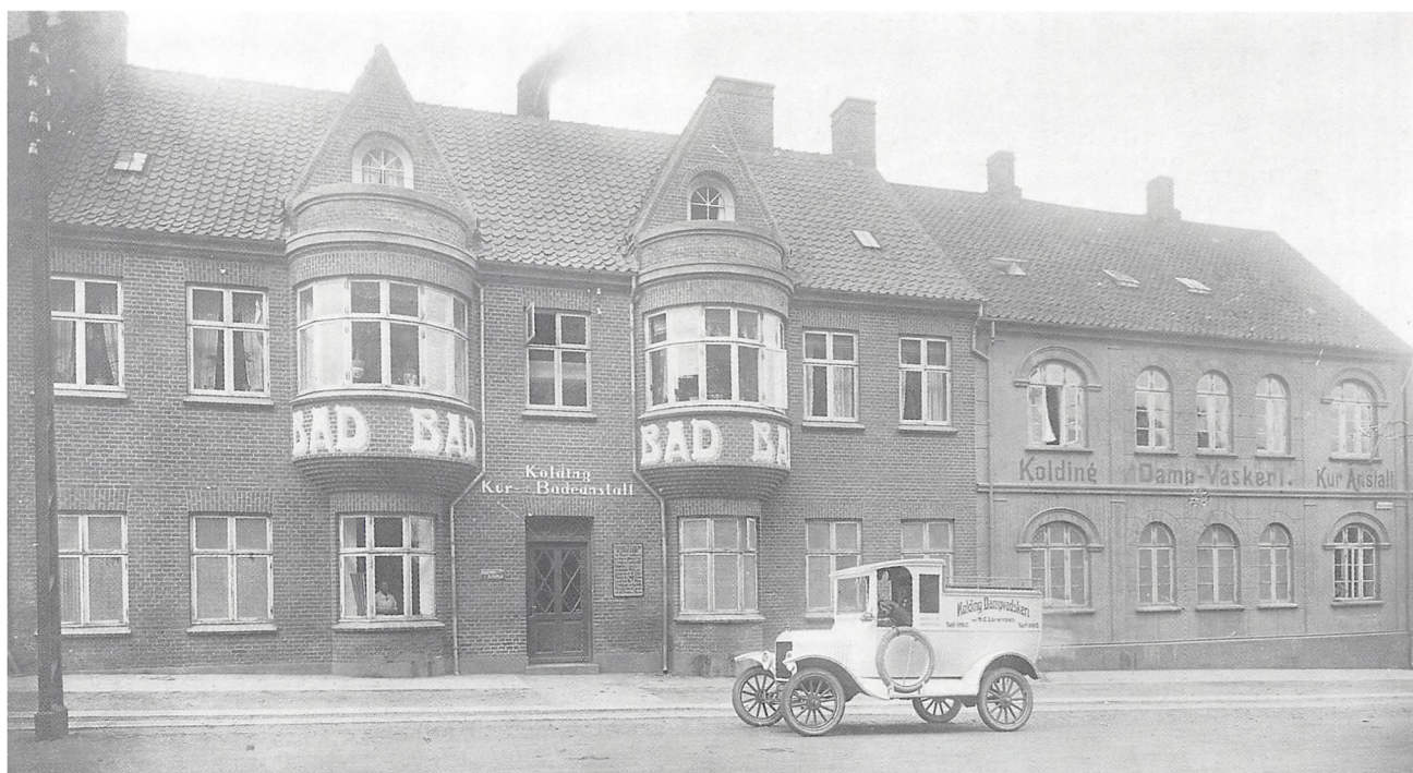
Kolding Dampvaskeri og Kur-Badeanstalt, 1922.

lem af familien. Mange Kolding-borgere vil kunne huske ham, der bragte vasketøj ud til stort set alle dele af byen gennem 39 år. Mod slutningen af 1930'erne var der ansat tre chauffører med hver sin varevogn. Maskinparken blev løbende fornyet og udvidet. Man ville gerne have det bedste, men købte aldrig på afbetaling eller stiftede gæld. Moralens var, at man købte, når pengene var der, og betalte kontant.