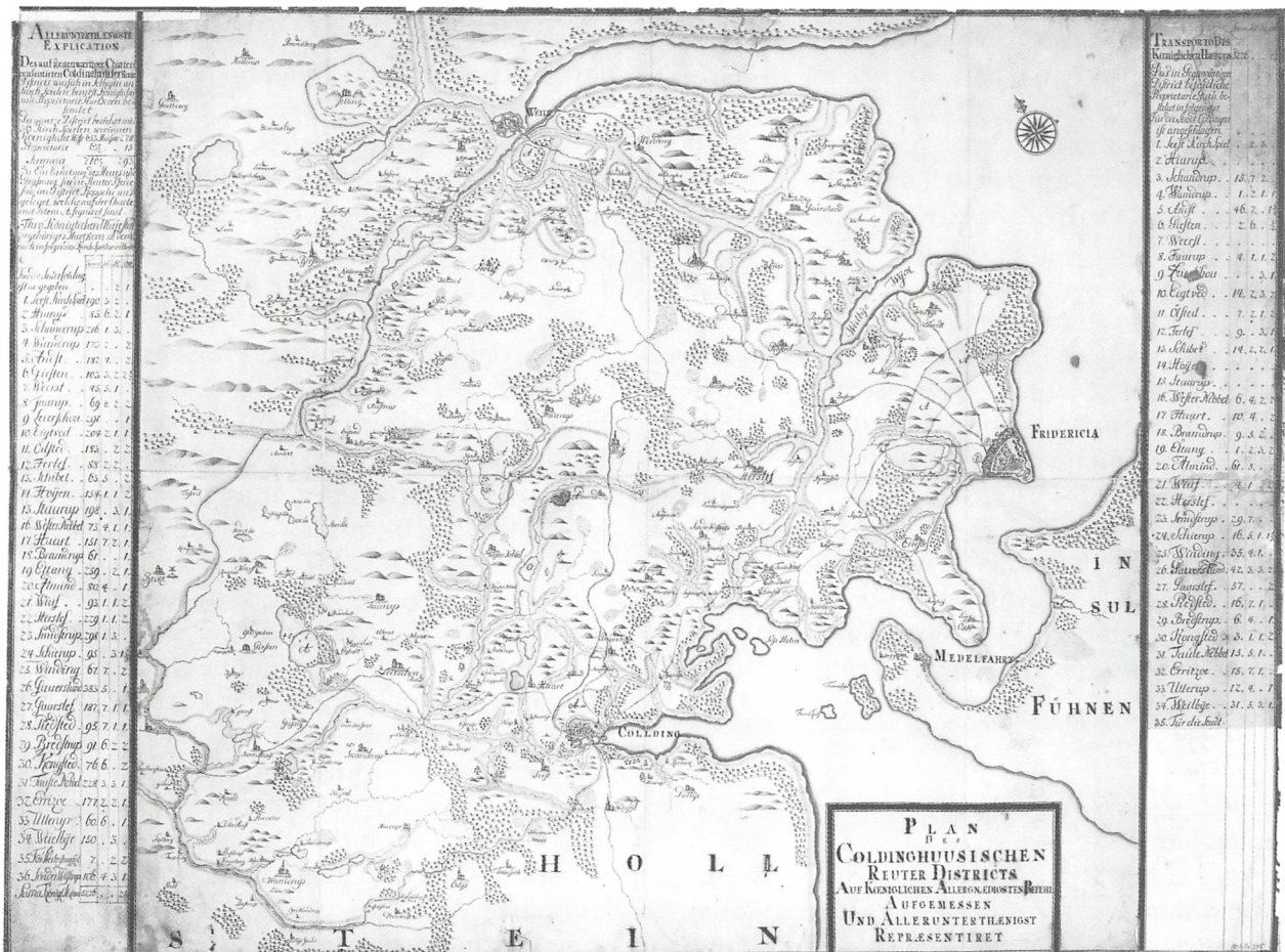
Kort over Koldinghus Rytterdistrikt, ca. 1720.

stod der stadig en trebenet malkestol. »Fjælen var let at optage, så ingen skulle høre det, særdeles som blev dem berettet, at hun med klagen og råben undertiden og næsten ideligt skulle have gjort larm, og når hun var nede af sengen ved bageovnen, stod straks en åben dør for hende«.