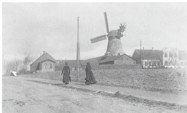
Gøhlmanns Mølle ca. 1880.

I november 1995 blev møllen af en møllebygger forsynet med en ny møllehat. Det blev fejret med et rejsegilde og hurraråb – men desværre fik den ikke den rigtige møllehat! Hatten blev nemlig af møllebyggeren forsynet med en