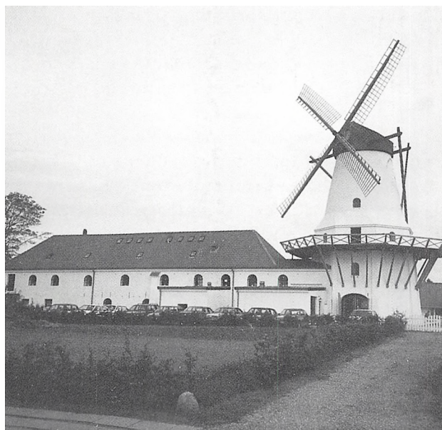
Møllen i dag. Som det ses desværre uden vindrose.

Den 6. januar 1959 solgtes møllen til O. Røn-nov Poulsen, som forsøgte at drive hotel- og restaurationsvirksomhed i hovedbygningen og