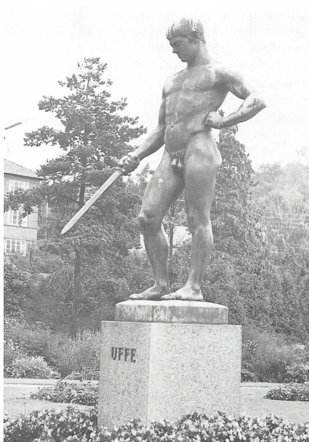
Anne Marie Carl-Nielsen: Uffe hin spage. Modelleret i 1927. Købt af Kolding Kommune i 1947, opstillet i Byparken.

Uffe blev dog ikke alene modelleret ud fra hendes gamle interesse for historie og sagn, men må ses på baggrund af, at hun i 1920'erne var optaget af at studere sportsfolk. Hun opsøgte sportspladser og -haller for at overvære træning og kampe, mens hun sad med små klumper voks