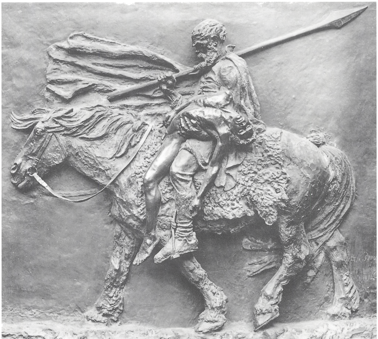
Anne Marie Carl-Nielsen: Egil Skallagrímson og hans døde søn. Bronze udført efter model fra 1889 i Kunstmuseet Trapholts samling. Skallagrímshólfur Reykjavík.