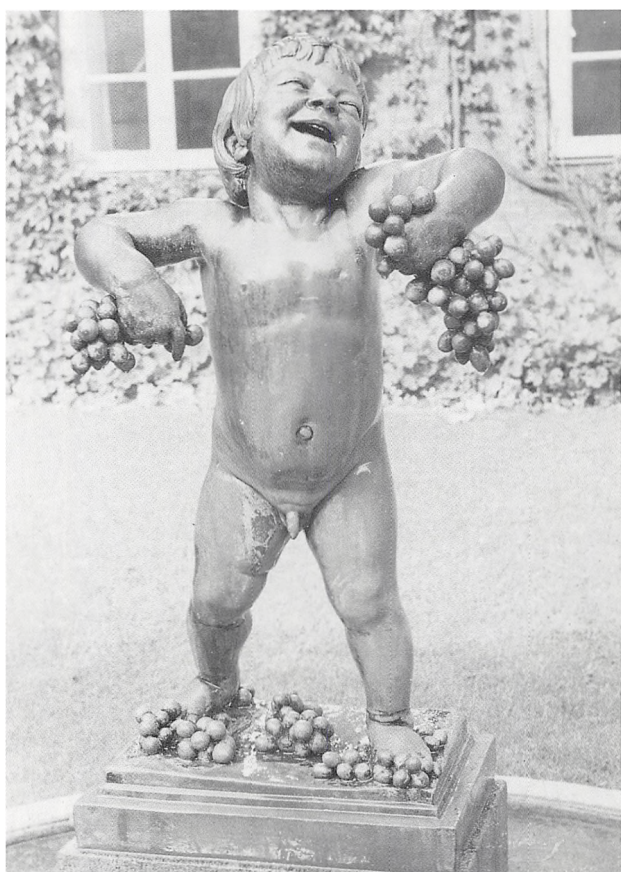
Anne Marie Carl-Nielsen: Bacchus-barn med druer. 1897. Opstillet i Rådhushaven i Kolding i 1933.

når den blev støbt i bronze, ved vi ikke. Men i 1906 blev den udstillet, og den er fremstillet i mindst tre eksemplarer. En findes i Ålborg, en i Albertinum i Dresden – og en altså i Kolding.