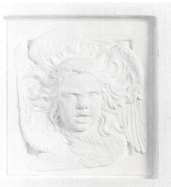
Anne Marie Carl-Nielsen: Relief i Sdr. Stenderup Kirke, opsat 1921. Oprindelig udført i 1904 til Ribe Domkirke.

Evangelistsymbolerne, der er anbragt på fire vægindsnit i hovedskibet, er ikke traditionelt fremstillet. Både løven, ørnen, englen og oxen, hvis hoveder er det eneste synlige, fordi de flade vinger omkranser dem, er skildret mere egensin-