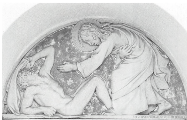
Anne Marie Carl-Nielsen: Lazarus' opvækkelse fra de døde. Kristkirken i Kolding. 1927.