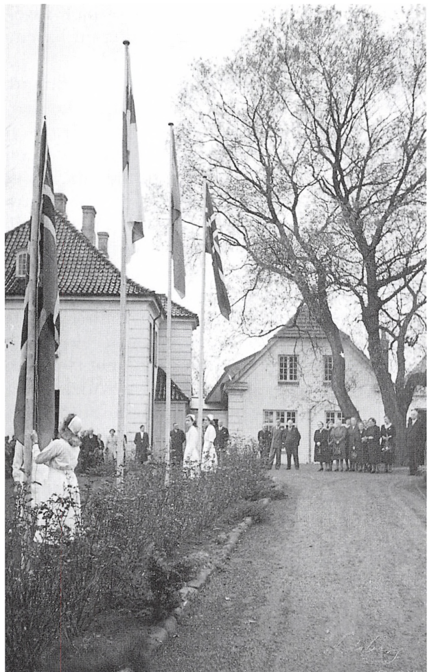
Husholdningsskolen Borrehus ved 50 års jubilæet i 1958.

Vi lejrer os udenfor Betlehem, hvor Hyrder til Hvile sig lagde, et Sendebud daler fra Glædens Hjem oh, hører I dog, hvad han sagde: »For Eder, for Eder, en Frelser i Dag er født«