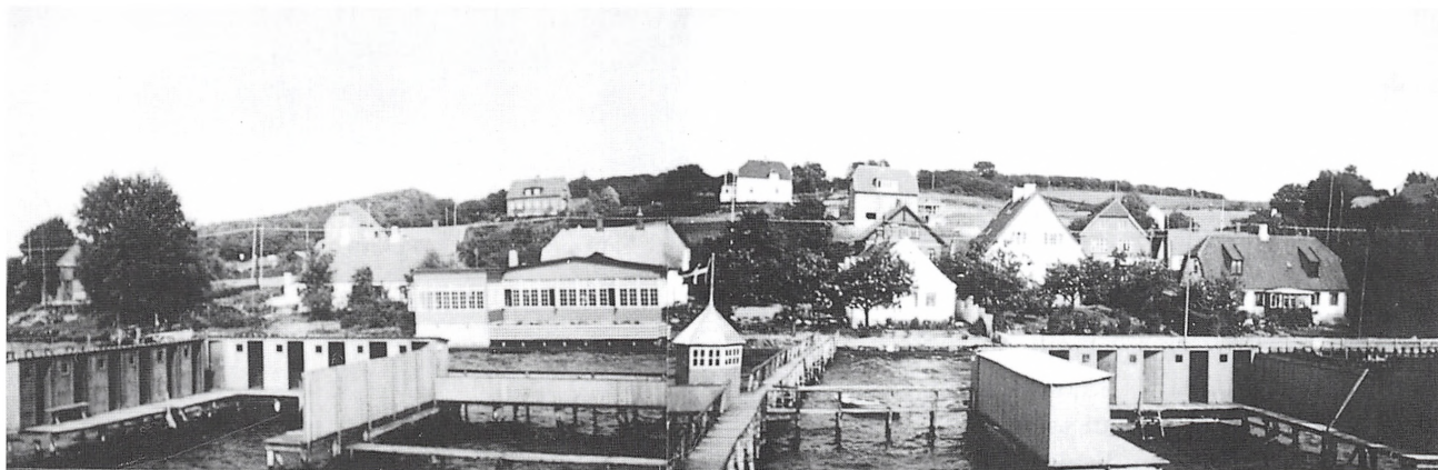
Grüns Restaurant og Badeanstalten i Strandhuse