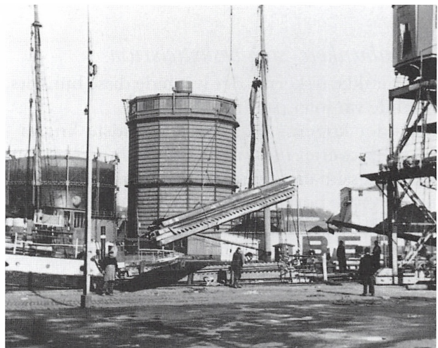
Transport og lastning af jerndele fra de belgiske haller på Kolding Havn, 1948

Så vidt jeg husker, fik vi ikke nogen særlig fortjeneste ud af det. Fortjenesten var nærmest kun, at vi fik en tur med vore koner til Begien, hvilket den gang var en stor oplevelse. I Belgien flød det med rigtig kaffe, bananer, appelsiner osv., alle de