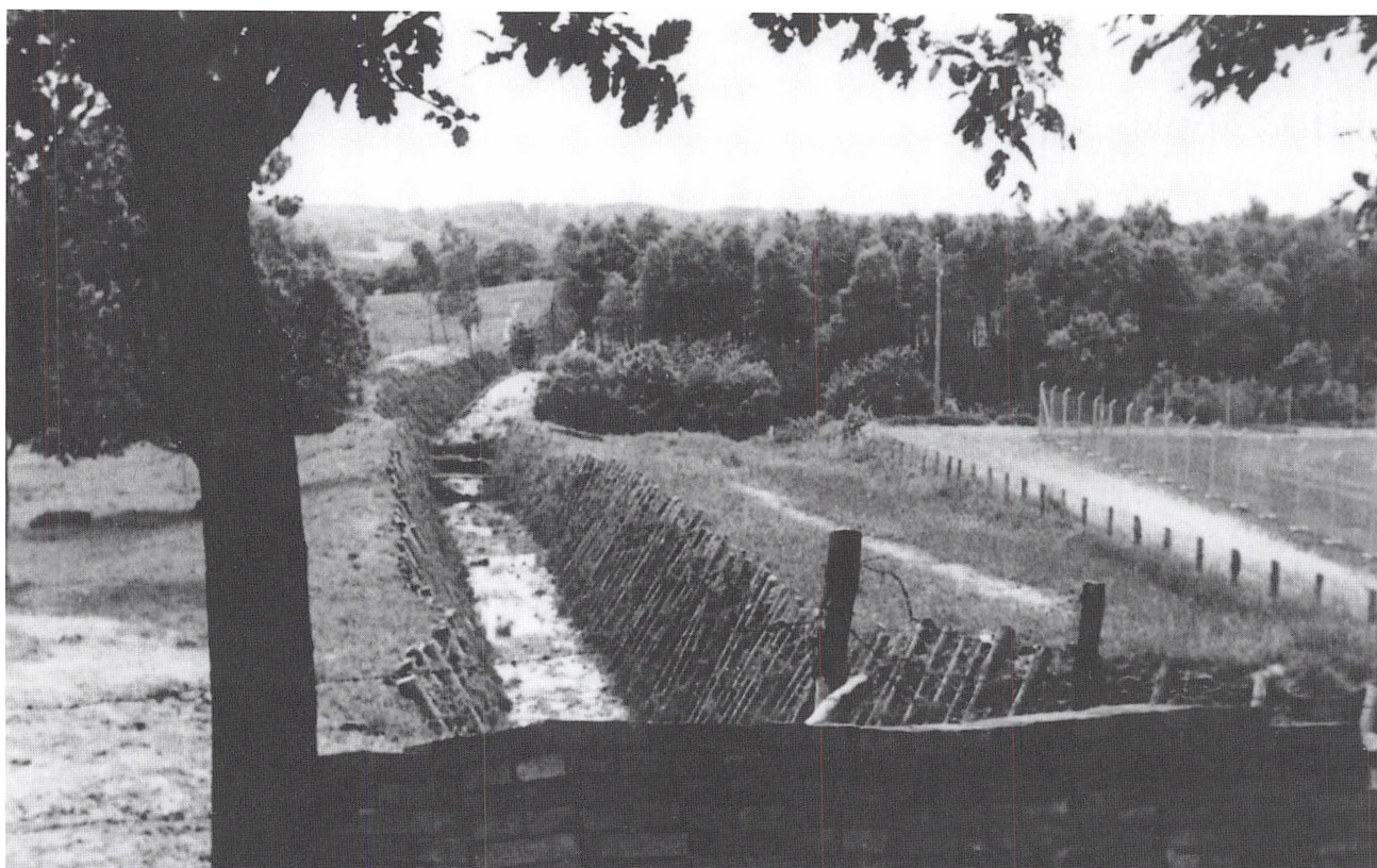
Tankgravene ved Harteværket fotograferet i 1946 af H. C. Ervald

Arbejdernes akkordpris var 1,10 pr. m 3 samt nogle tillæg for længere tril end 8 m og evt. stigninger på trillebanen. De af arbejderne, der kunne og ville, tjente på akkorden ca. dobbelt timeløn.