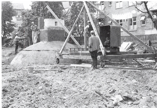
Før nedbrydning af bunker i Sydbanegade

1.200 kr. lyder billigt, men det var faktisk den rigtige pris. Prisen skal sammenlignes med, at timelønnen til en arbejdsmand på den tid incl.