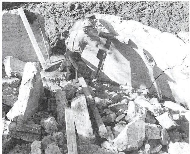
Mine folk i gang med »afskrælningen« af bunkerens sider

Jeg tror, mine folk nød arbejdet. Der ligger nok et eller andet gemt i mennesker, at de somme tider finder fornøjelse i at smadre noget. Små drenge baldrer ruder. Nu baldrede vi en bunker. Mange mennesker stod og betragtede