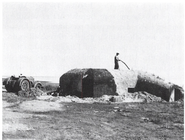
Midt i hver rum i Bunkeren var anbragt en afmålt ladning Trotyl. Efter at alle huller var tætnede, blev bunkeren fyldt med vand