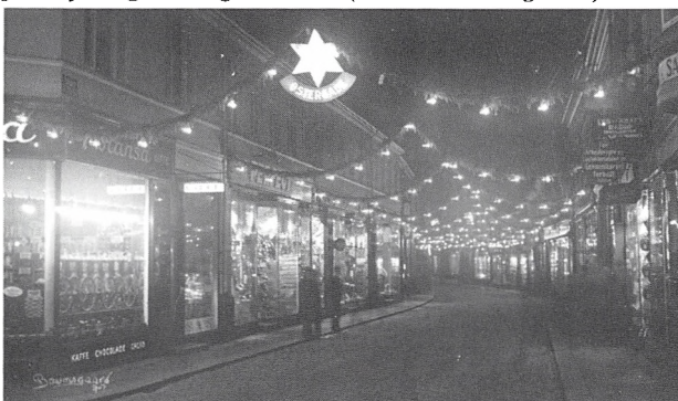
Julebelysning i Østergade 1931.

Vores far arbejdede som havnearbejder og måtte i de kummerlige 30'ere ofte gå arbejdsløs. Understøttelsen var dengang 18 kr. om ugen. Som et nødvendigt supplement blev der bevilget ekstra 1 kr. pr. barn, det gav i vort tilfælde 7 kr. til de 18 kr. Så var der rigtig smalhans i hjemmet, og rationerne blev små. Min far var meget ærekær og ærlig. Al godgørenhed, bortset fra Samaritanen nægtede han at tage imod, selv fastelavnsmandag forbød han os at gå ud at rasle. Vi misundte de andre, der i laset tøj som udklædning fik både penge og boller. Hans børn var ikke tiggere. Han drak aldrig øl eller spiritus. Han havde lovet sin mor, at han aldrig ville ryge eller bande, det løfte holdt han og forlangte selvfølgelig, at vi andre også respekterede det, så tonen i hjemmet var næsten for sober. Der var dog en gang, han dumpede i. På en eller anden måde var han kommet i et spil kort i havnestuen og havde tabt 10 kr. Han ærgrede sig i mange dage og lovede sig selv, at han aldrig mere ville spille kort om penge. Det løfte holdt han, til han blev pensionist. Vi havde en vældig respekt for ham, vovede end ikke at hæve stemmen, når vi talte, ej heller vovede vi at sige ham imod. Han slog os så at sige aldrig, den korporlige revselse tog min mor sig af, men vi følte altid, at fatters hånd alligevel ikke var til at spøge