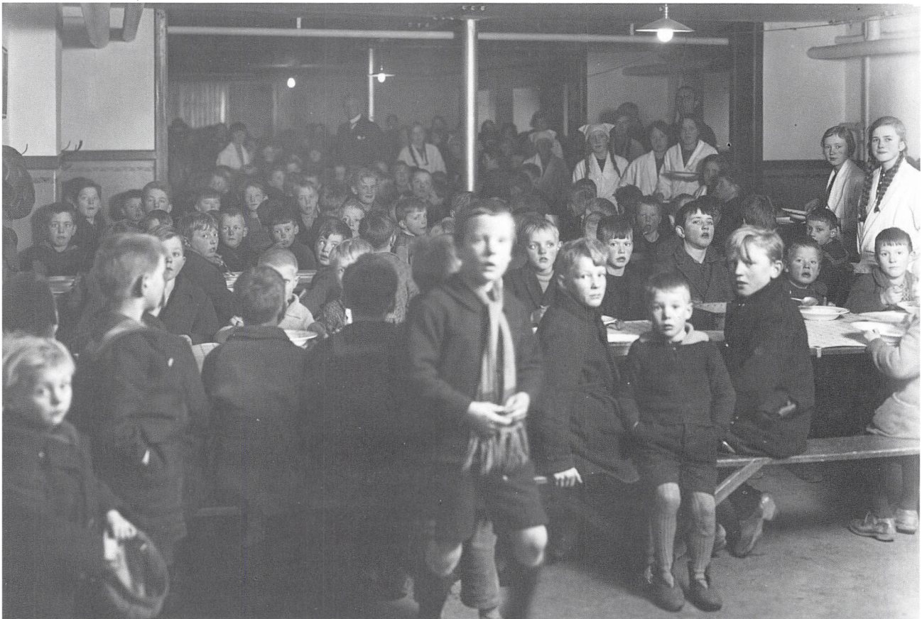
Børnebespisningen, februar 1930.

Terrænet omkring Havneboligerne var som skabt til børn, og her fandtes da også byens bedste legeplads. Kommunen havde lagerplads for store kloakrør, dem behøvede vi kun at hænge en sæk for hver ende af, så havde vi en hule. Det var dog mere spændende selv at lave en af træ, som det flød med overalt. Fåborgs vognmandsplads og Th. Petersens områder var også