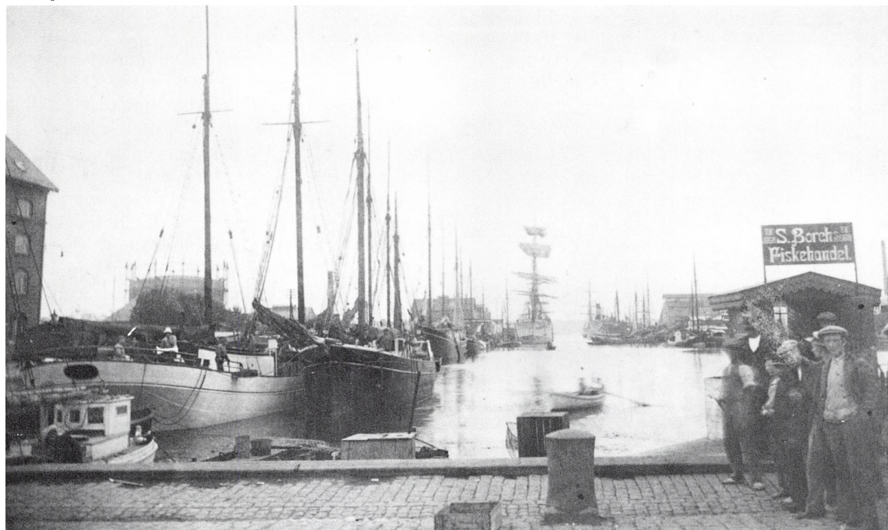
Kolding Havn i 1920erne

gang var mellem 150 og 200 havnearbejdere. Der kunne være perioder, hvor der ikke var så mange skibe i havnen, så var chancerne for B-folkene ikke så gunstige. Han begyndte derfor som fisker. Den første båd, han havde, havde kun sejl som drivkraft. Det er mig komplet uforståeligt, at det kunne lade sig gøre at fange fisk på den måde. Store ting blev det da heller ikke til. Dog husker jeg, at en fisk som ålekvabbe nærmest var en plage for fiskeriet, dem var der