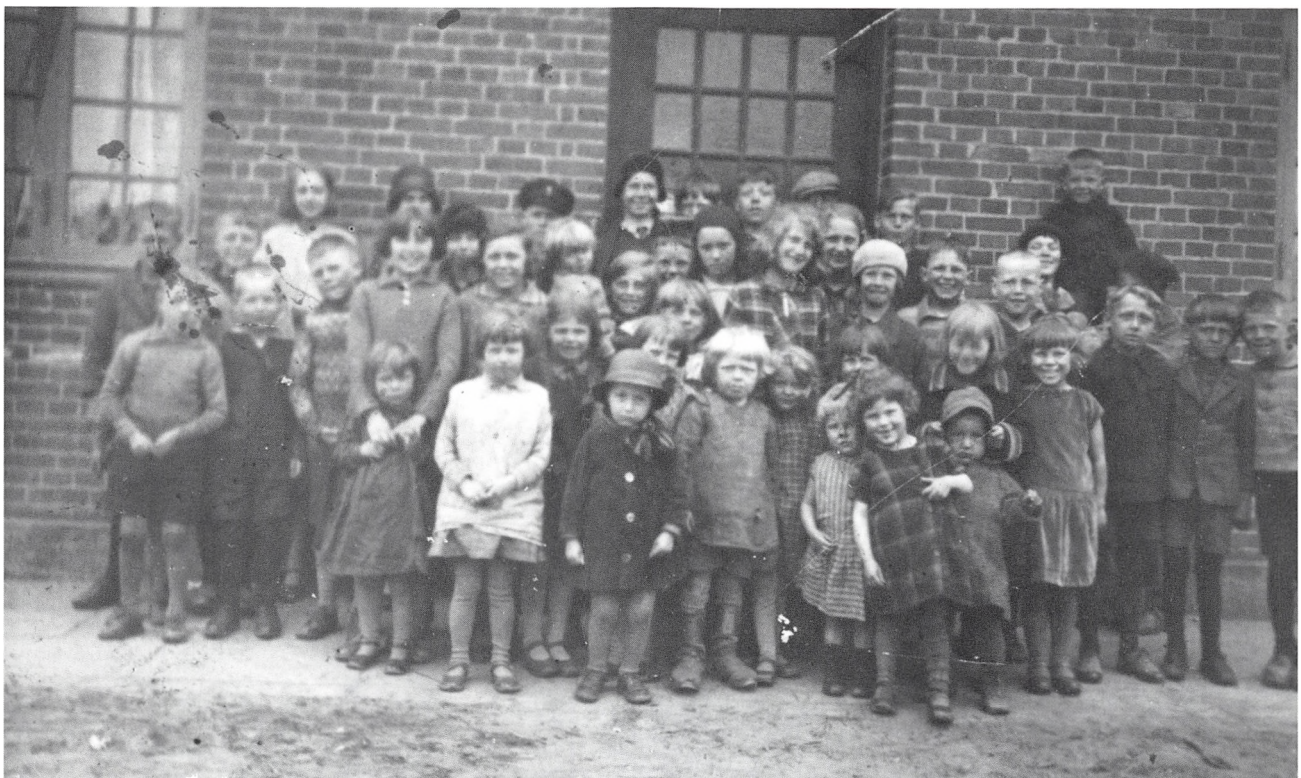
Havneboligunger fotograferet i 1920'erne.

bad om en lille eller en stor portion, som vi var sultne til. Det kunne vi gøre lige så tit, vi ville.