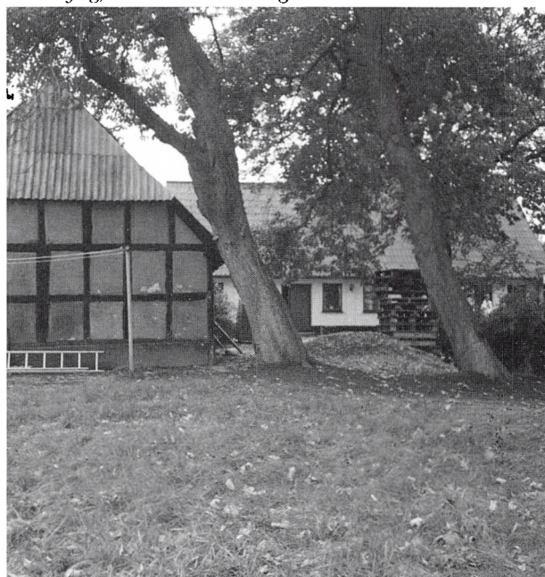
Ravnshjerg, som det ser ud i dag.