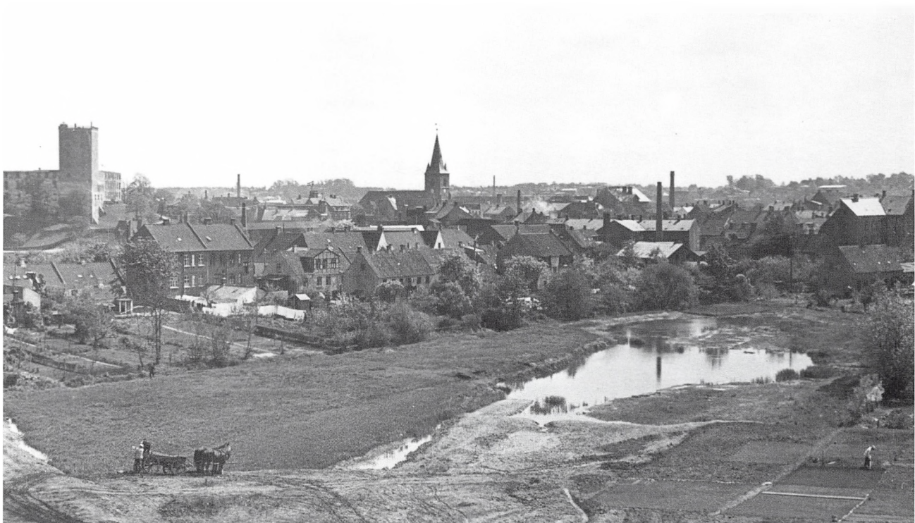
Vejdam under opfyldning.