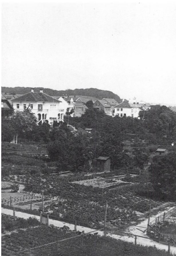
Hospitalshaverne og konsul Effs villa.

udmærket, og der var ingen strømproblemer, det var en brødmotor.