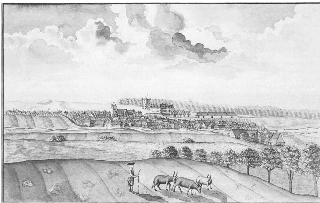
Prospekt over Kolding fra Frederik 5.s atlas, 1755. Original i Det kongelige Bibliotek.

havde fået i 1718, på grund af den store afstand, over to mil, og træ fra skovene kunne de ikke længere få«. Derfor var det næsten umuligt at skaffe det brændsel, som borgerskabet »så strengelig var ansat for«. Og dog var det store kvantiteter, der skulle skaffes, 246 portioner (husstande?) á 6 læs, ialt 1476 læs. Endog af Vonsild by, skrev de, hvor en del af borgerskabet tidligere for penge havde kunnet skære deres tørv i Svanemosen, var det nu blevet forbudt. Deres eneste hjælp var